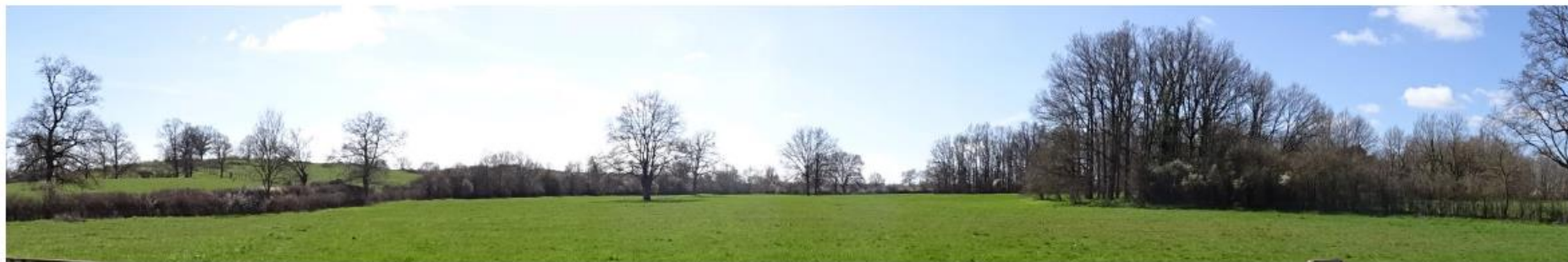
Figure 2 : Prise de vue éloignée – En direction du sud