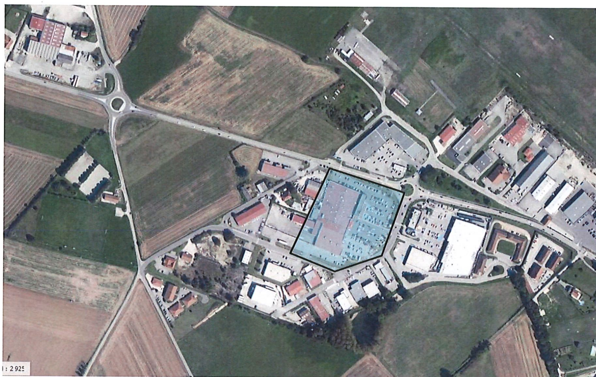
Figure 7. Zone où le site est visible.

Le site n'est pas visible dans un environnement lointain. Ci-dessous la carte de la zone où le site est visible :