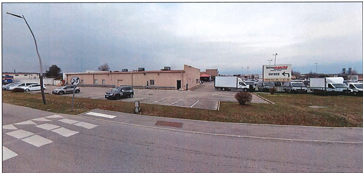
Figure 6. Photographie N°3 (google, 2023).