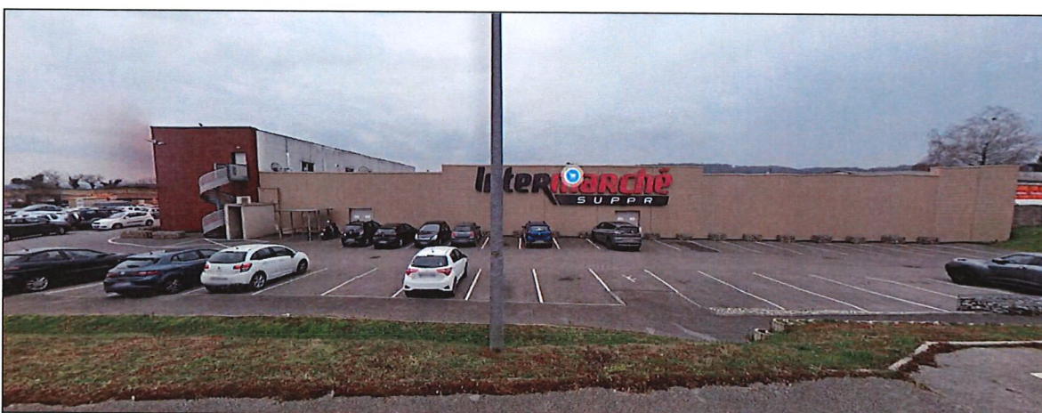
Figure 4. Photographie N°1 (google, 2023).