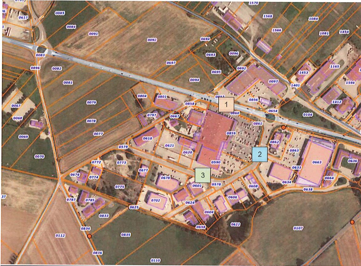
Figure 3. Point de prise de vue des photographies.