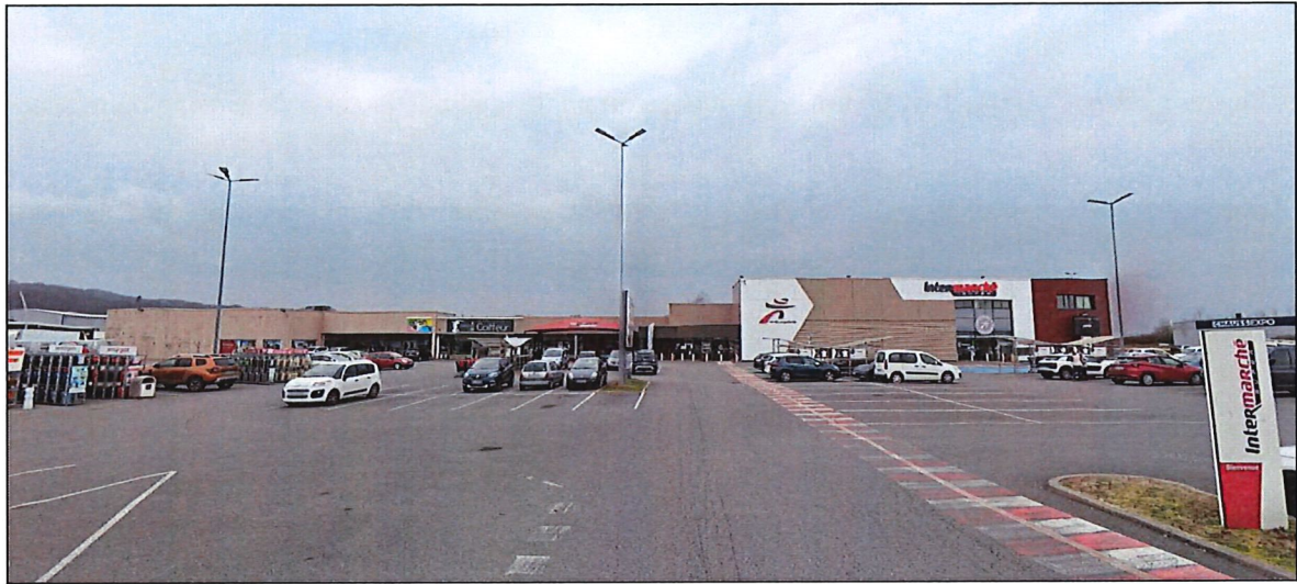
Figure 5. Photographie N°2.