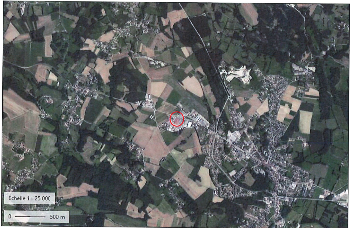
Figure 1: Situation géographique satellite du projet au 1/25000.