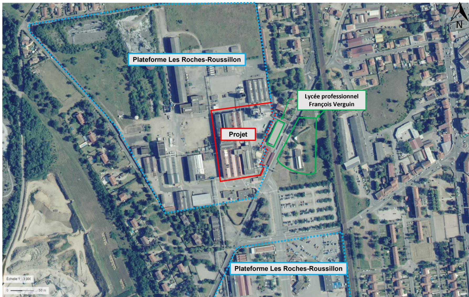
Annexe 5. Plan des abords du projet