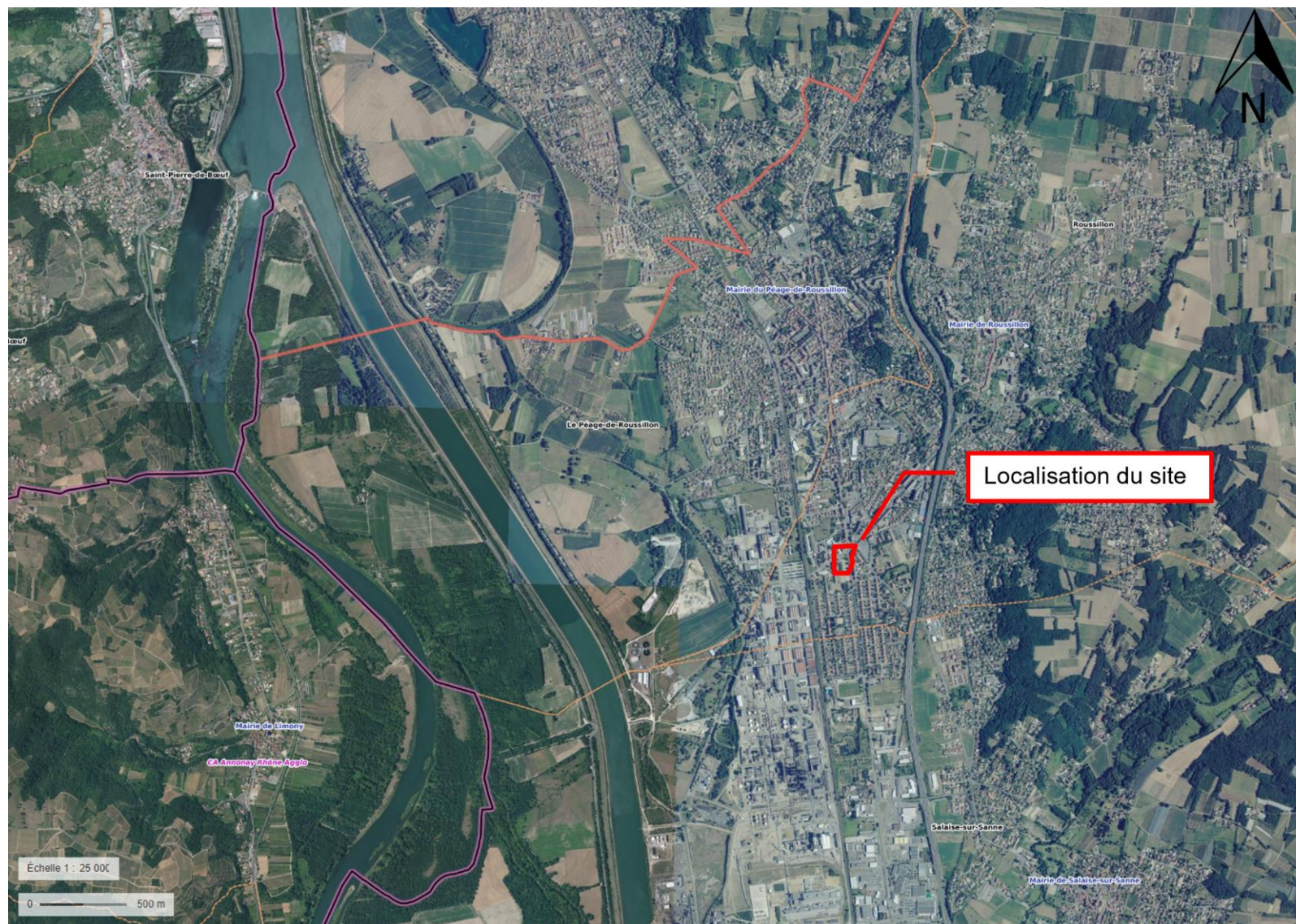
Annexe 2. Plan de situation au 1/25 000