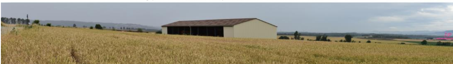
Photographie 6 : Vue en direction de la ZIP depuis la D131 au sud de Reventin-Vaugris.