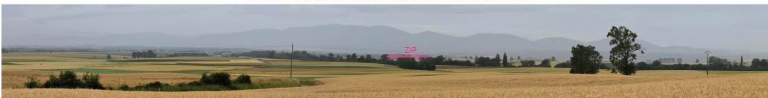
Photographie 7 : Vue en direction de la ZIP depuis l'extrémité ouest de Saint-Mamert.