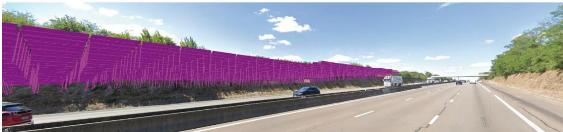
Photographie 31 : Vue 2 depuis l'autoroute A7, état projeté (vue en esquisse).