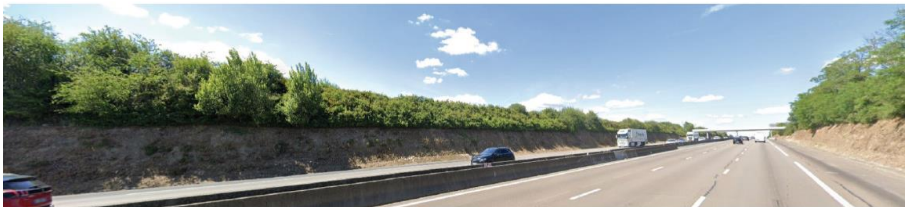
Photographie 30 : Vue 2 depuis l'autoroute A7, état initial (vue Google Earth).