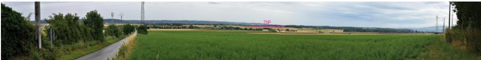
Photographie 5 : Vue en direction de la ZIP depuis l'allée des Mûriers au sud de Chonas-l'Ambellan.