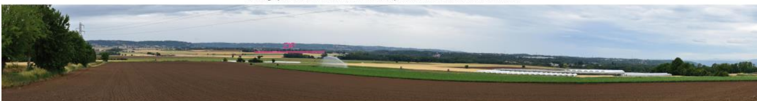
Photographie 8 : Vue de la ZIP depuis la route de Vienne au sud-est de Saint-Prim.

→ D'autres photos permettant de situer le projet dans le paysage lointain sont présentées en Annexe 9 – Diagnostic paysager