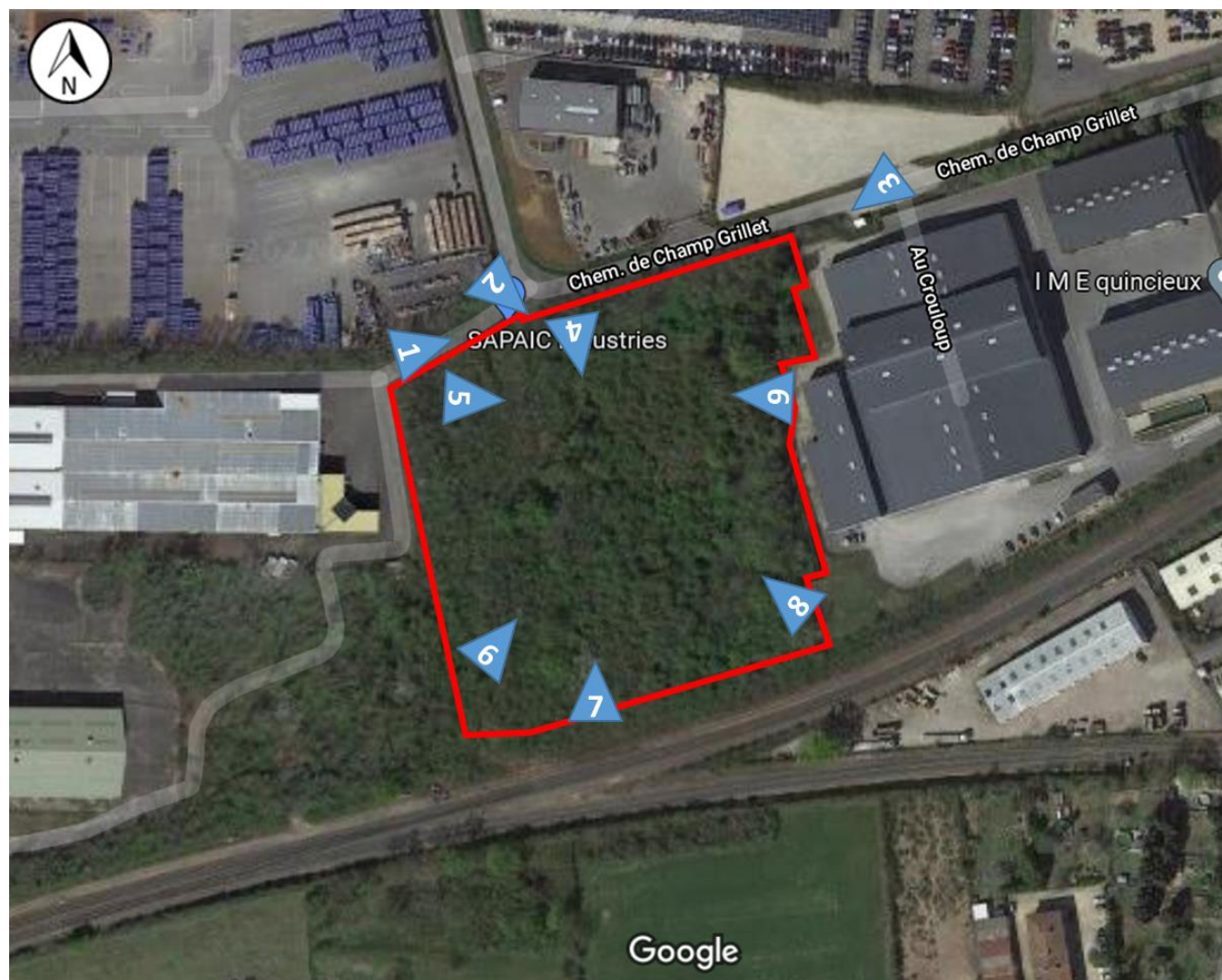
Localisation des photographies