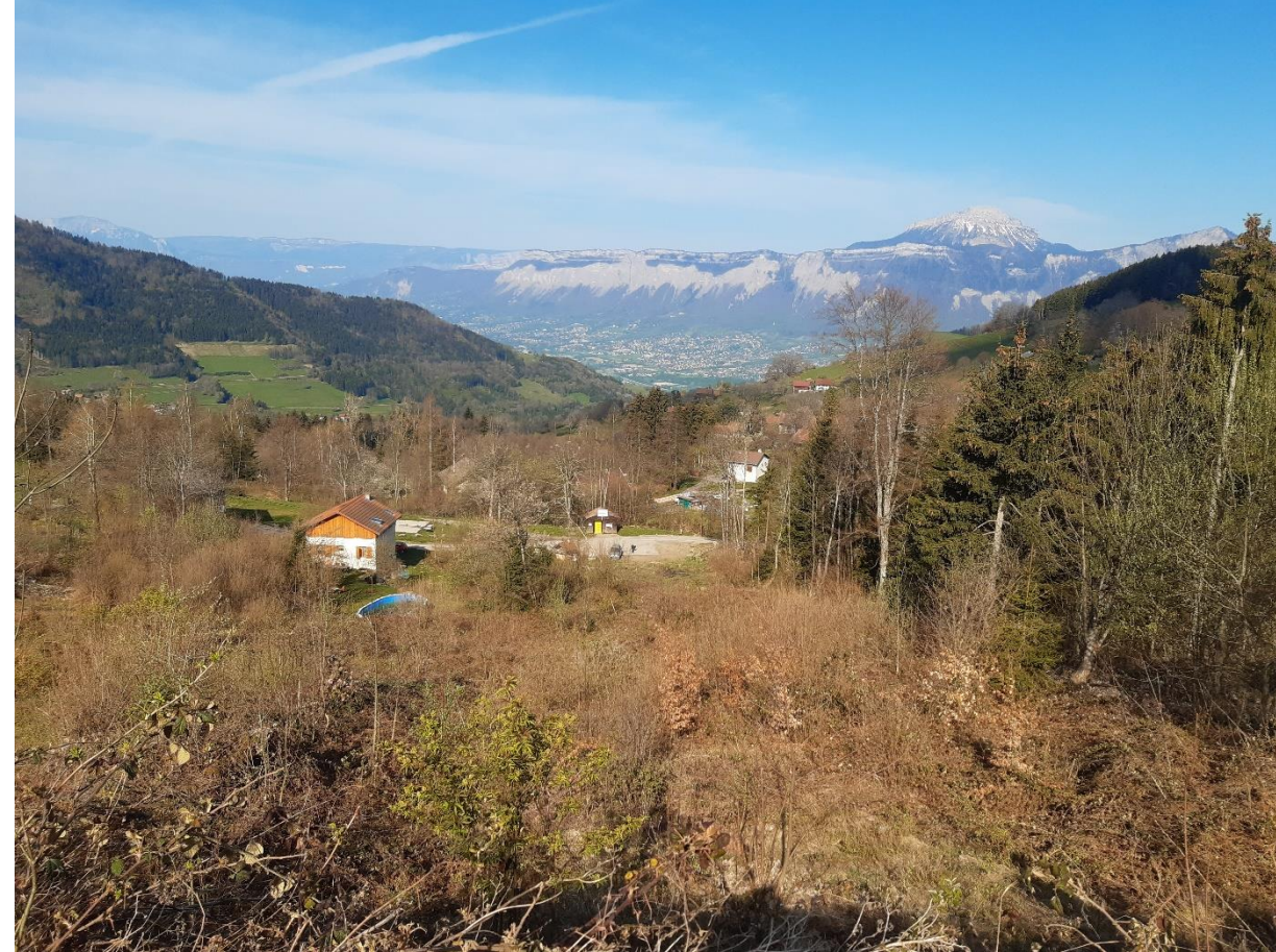
Parcelle C1383 – photo prise depuis le haut de la parcelle, vue sur l'ouest