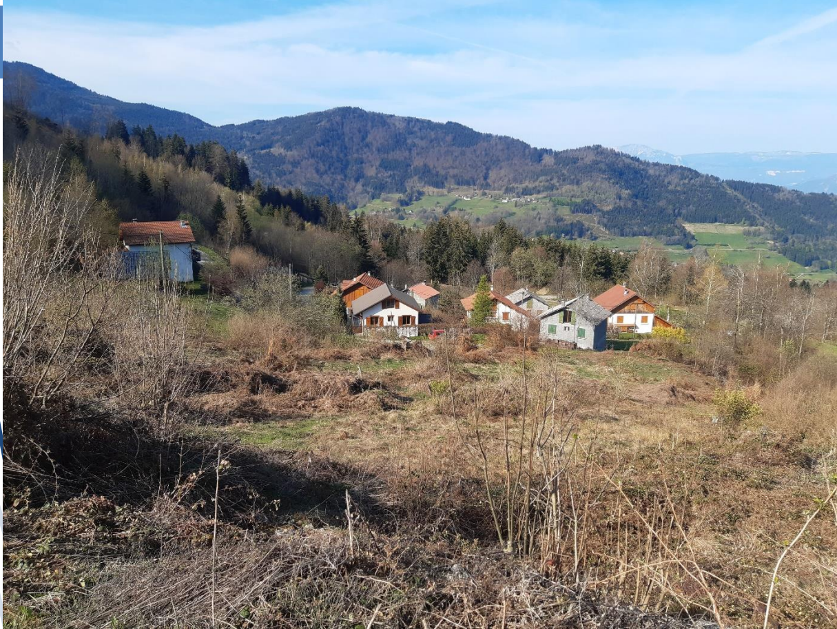
Parcelle C1383 – photo prise depuis le haut de la parcelle, vue sur le sud