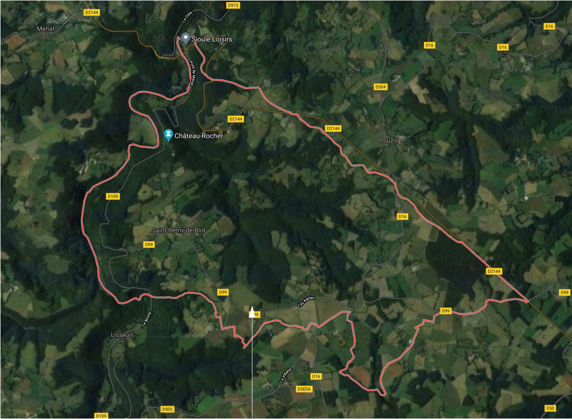
Commune de Saint Rémy de Blot

Maitrise d'Ouvrage : Camping motos Route 99 Les Mureteix 63440 Saint-Rémy-de-Blot