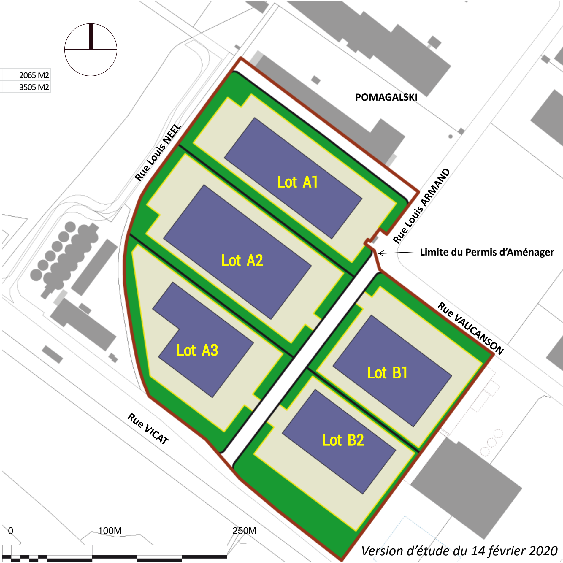
Version d'étude du 14 février 2020