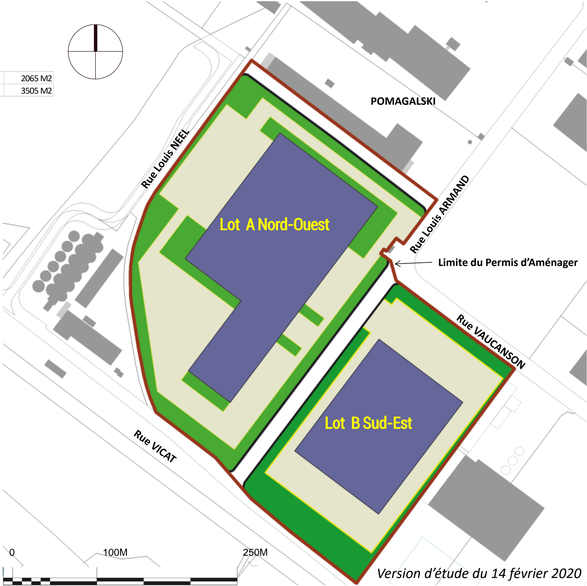
Version d'étude du 14 février 2020