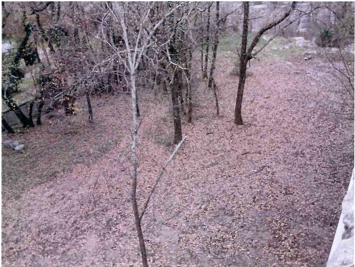
Vue n° 4