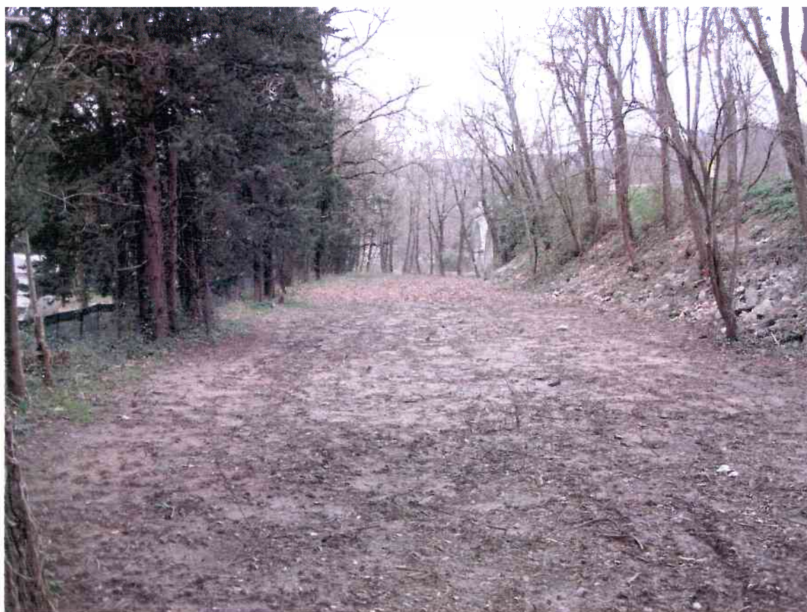
Vue n° 2