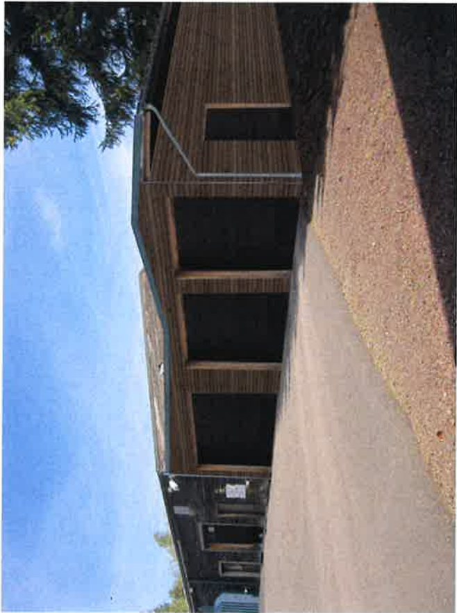
PC 6 - Document d'insertion