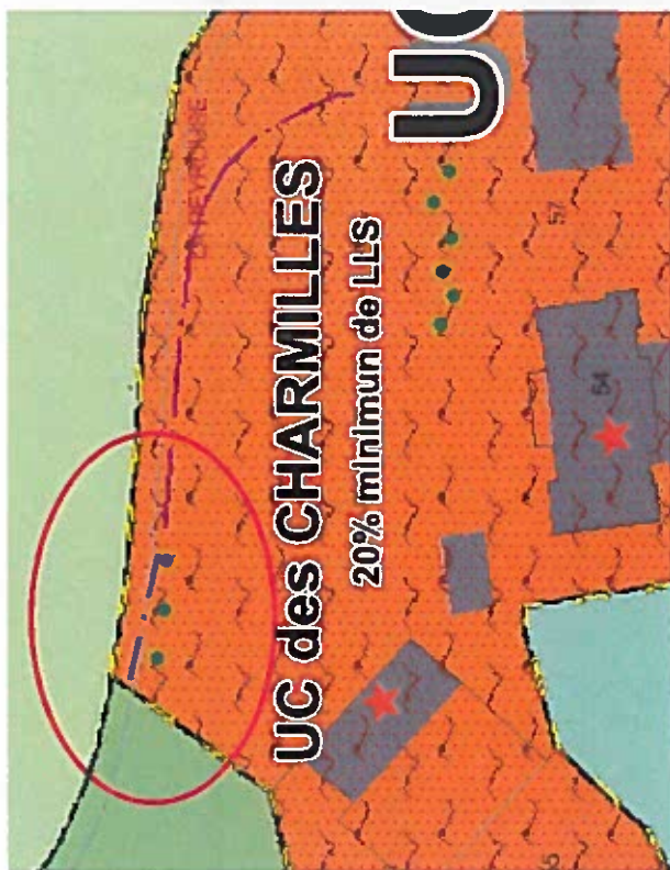
Extrait du PLU après la Modification simplifiée n° 1