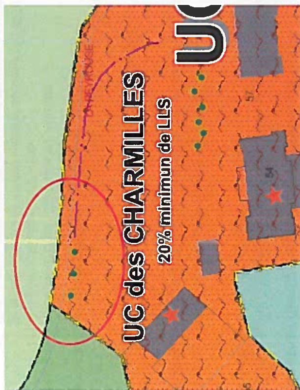
Extrait du PLU avant la Modification simplifiée n° 1