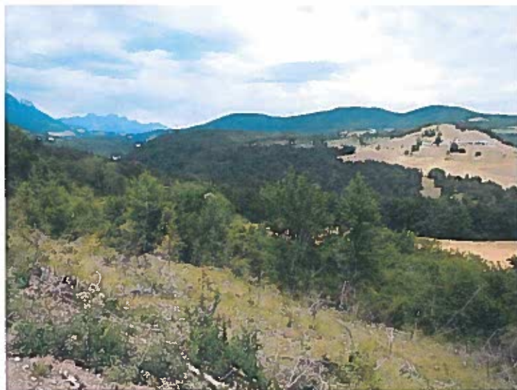
Parcelles ZC8 et A31