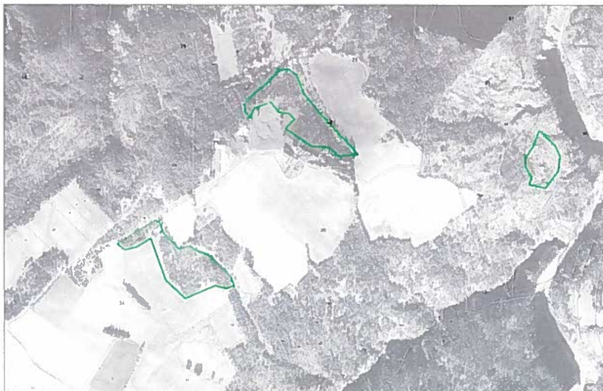
Situation photo-aérienne IGN de 1984