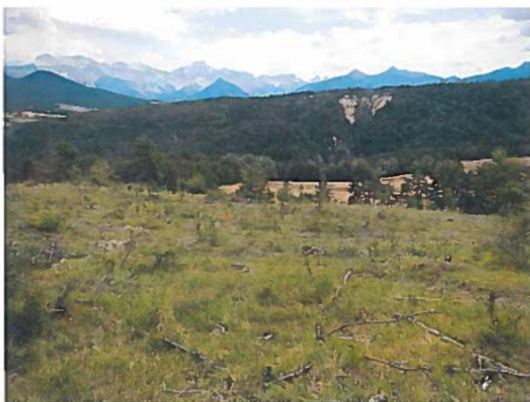
Parcelle ZC 34