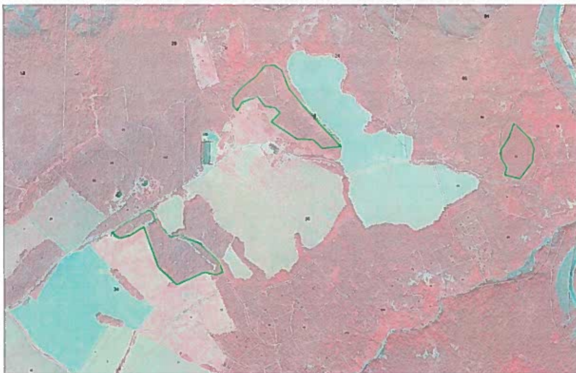
Situation BDORTHO IGN 2012 IRC

Les parcelles ZC34, ZC31, A 8 et A55 étaient pâturées en 1948. Les parties de parcelles n'ayant plus été pâturées de façon intensive se sont boisées naturellement en un peuplement de pin sylvestre qui n'a jamais fait l'objet d'exploitation jusqu'à la coupe récente de bois de faible valeur économique (hauteur inférieure à 10 m, faible diamètre et arbres branchus).