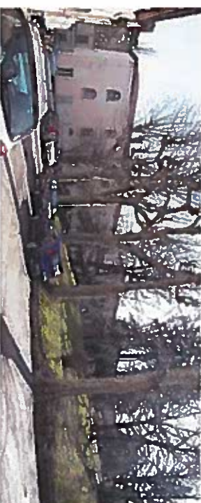
4. Le bas du clos