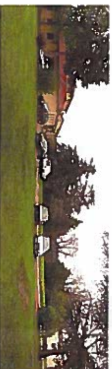
2 Le haut du clos