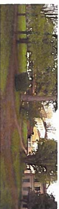
8. Les terroisses