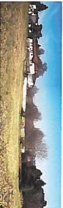
1. Le haut du plateau