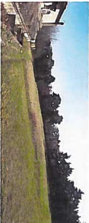
3. Le bas du plateau