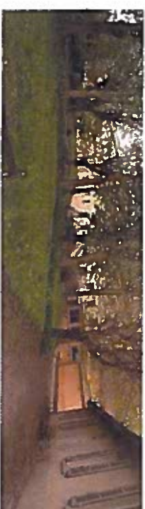
7. Les terrasses