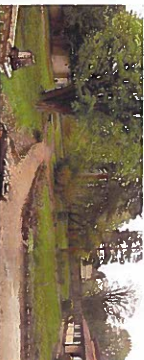
6. Les terrasses