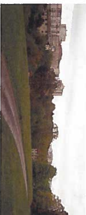
5. Le haut du vallon