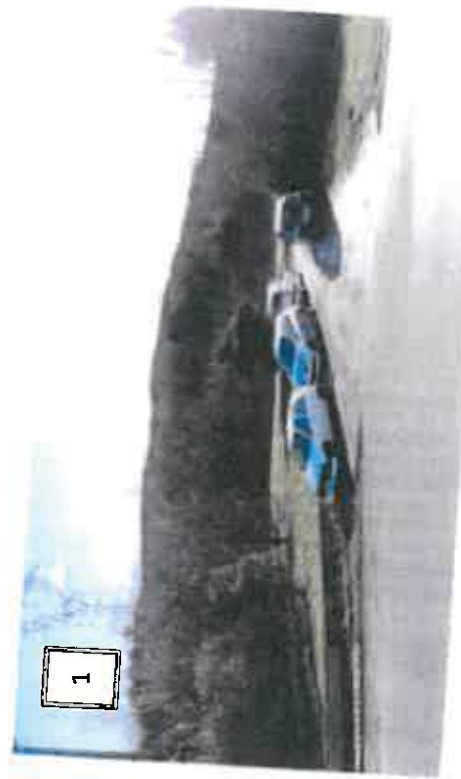
Annexe 3 – Prises de vue du site (photos 1 à 3 prises en mars 2015 et repérées sur l'annexe 3. Photo 4 en mai 2015)