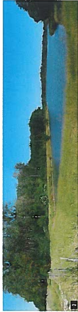
2 L'étang nord