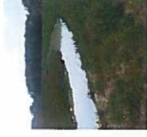
Réalisation de frayères