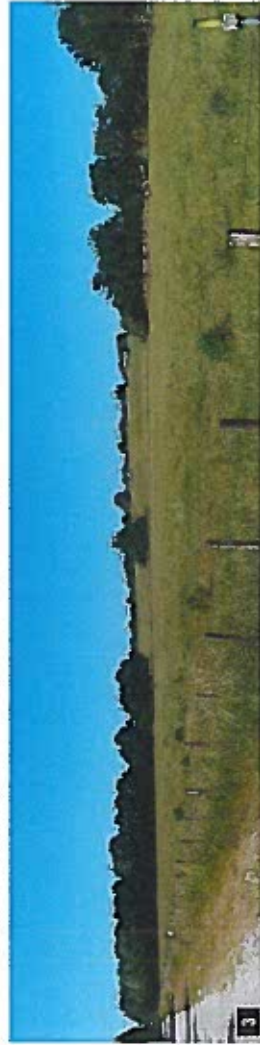
3 La prairie pâturée