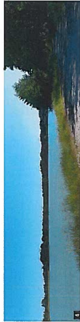
4 Le grand plan d'eau de pêche bordé par le chemin de Riottier