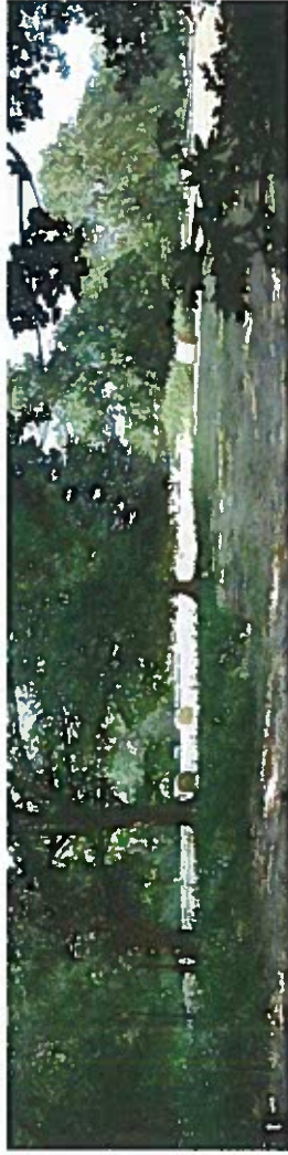
1 La prairie bocagère