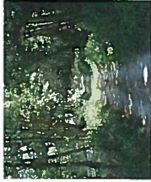
Le chemin de Riottier