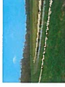
Plantation de haies