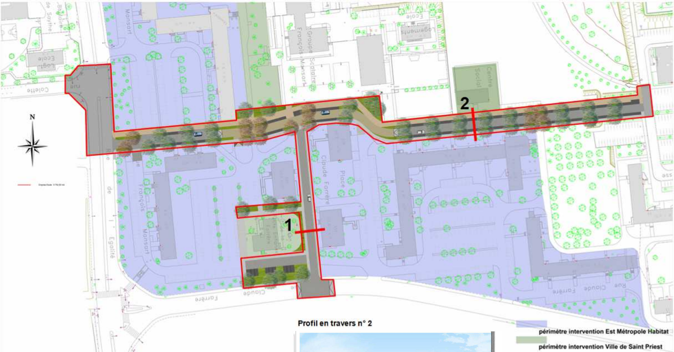
Profil en travers n° 1