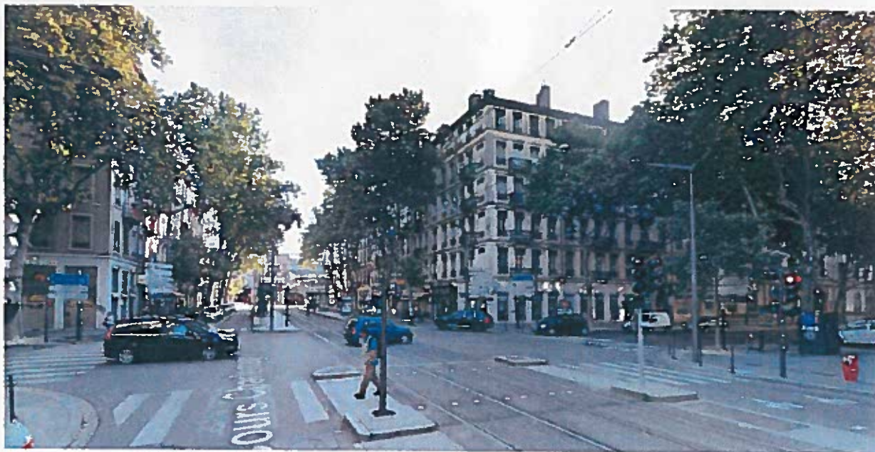
A - Vue du cours Charlemagne et de la station Suchet depuis le Sud