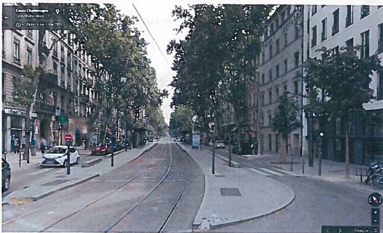
C - Vue de la station Suchet depuis le Nord