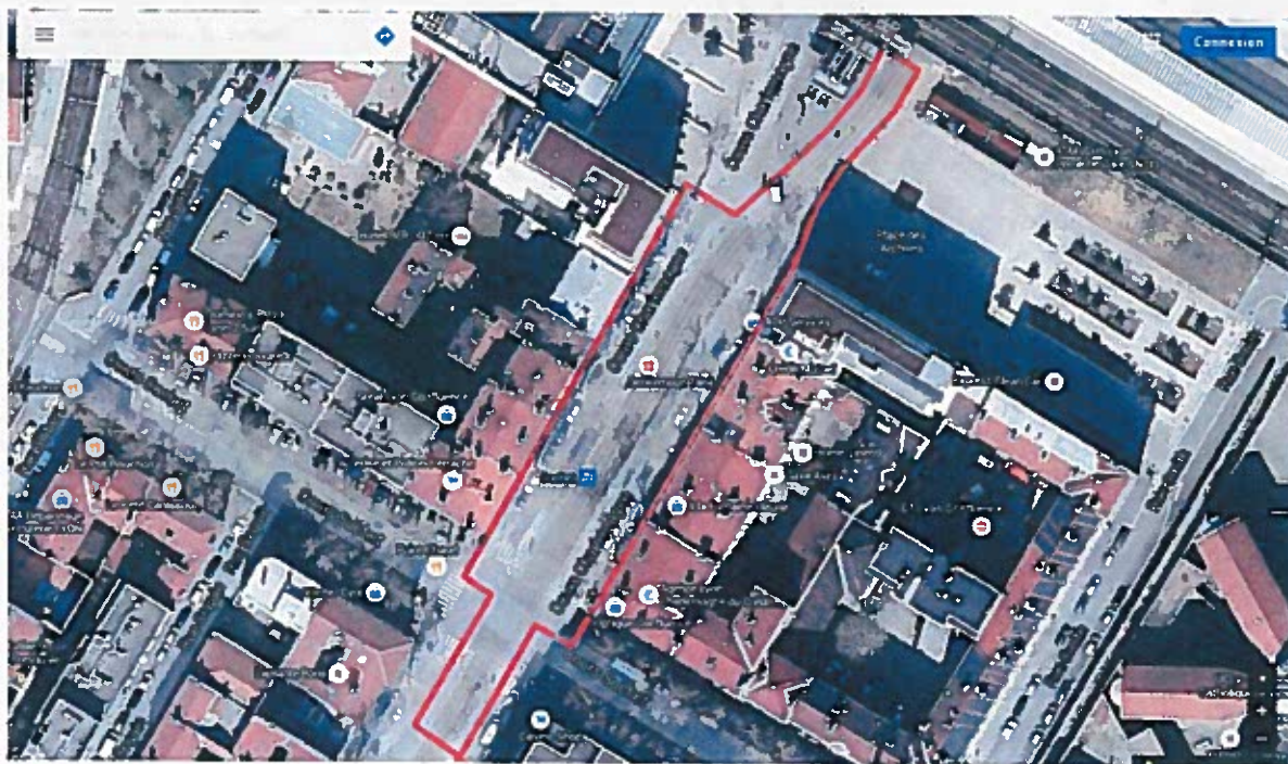
Périmètre du projet