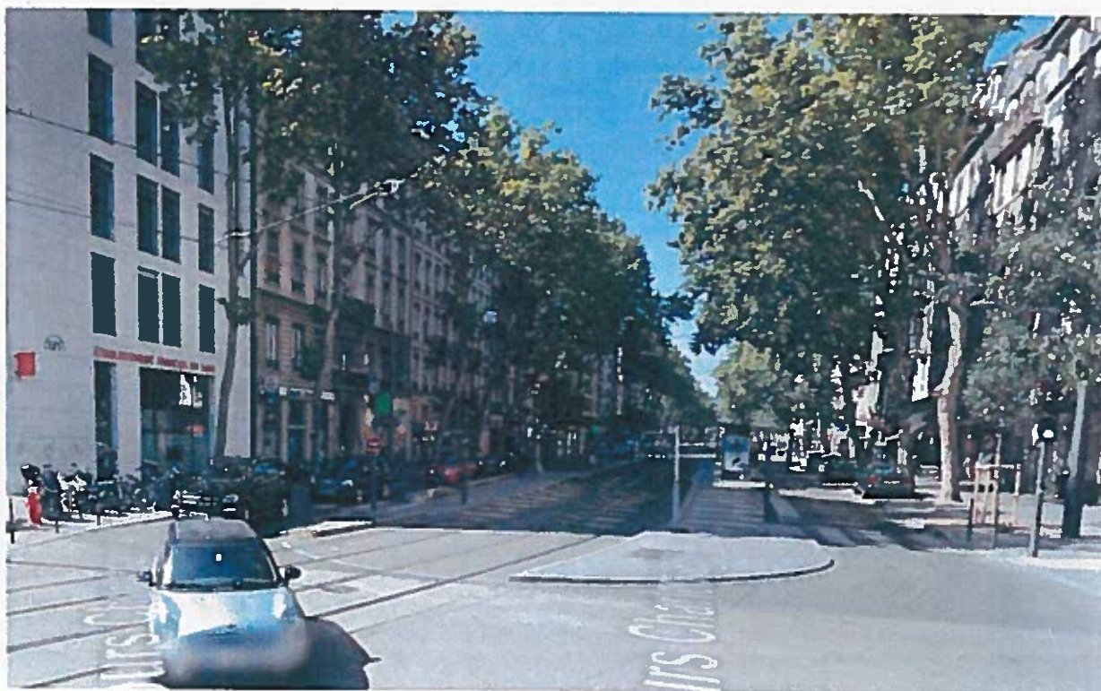
B - Vue de la station Suchet depuis le Nord