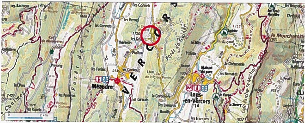
Plan de situation n°1