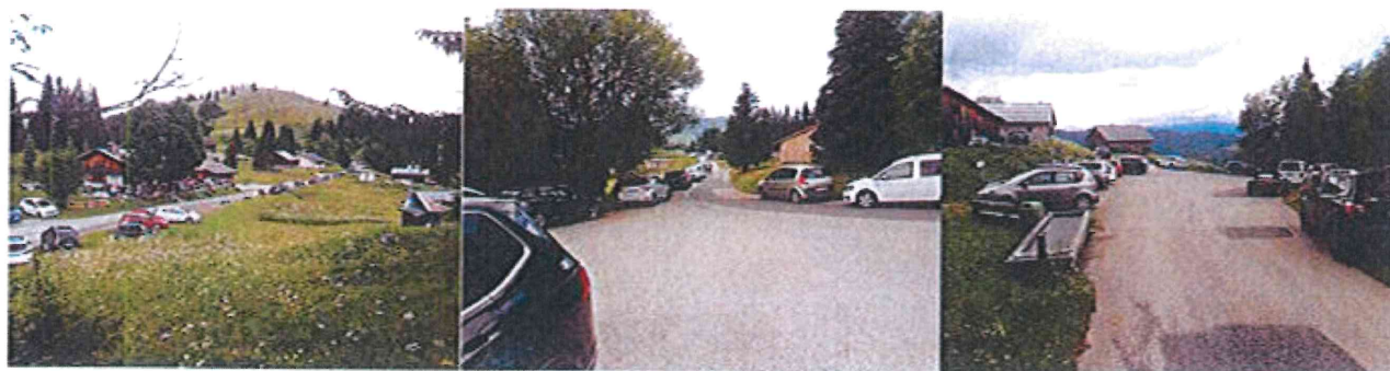
Photos du site déjà saturé en stationnement en fréquentation hors saison (21 juin 2020)

Le trafic des véhicules visiteurs sera ainsi supprimé sur le mont Caly.