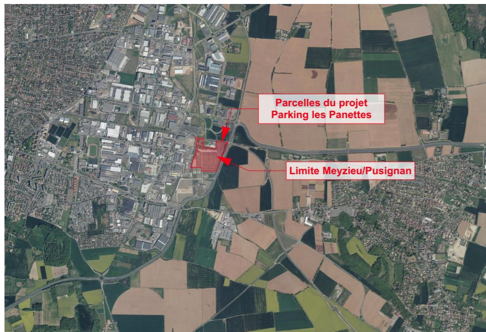
PLAN DE SITUATION - vue aérienne rapprochée