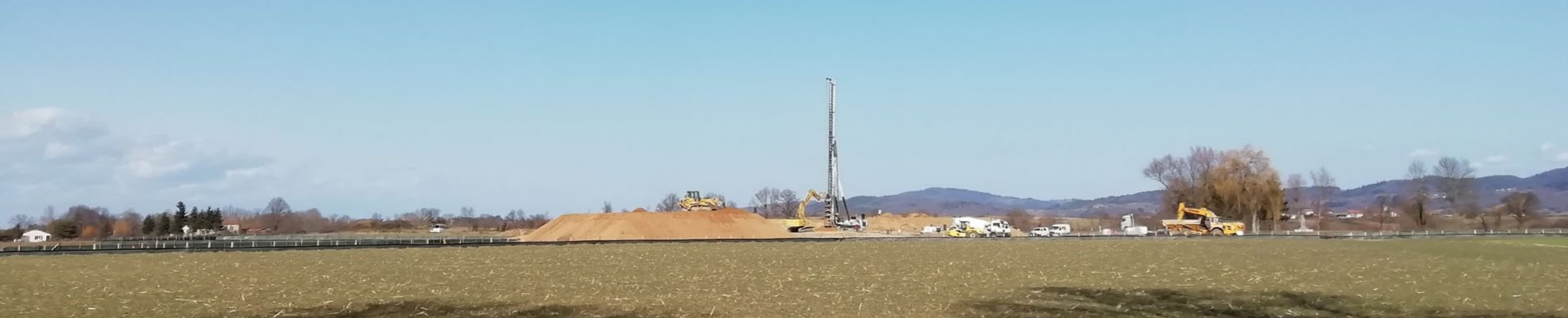
Construction des fondations du PS10 qui permettra de rétablir l'allée de Barlières.

Le chantier de reconfiguration de l'échangeur de Lempdes-sur-Allagnon sur l'autoroute A75 (échangeur n°20) a débuté par la phase de travaux préparatoires. Durant 7 mois, des modifications de circulation sont à prévoir. La majorité des fermetures seront effectuées la nuit afin de limiter les incidences sur l'accès à l'A75.