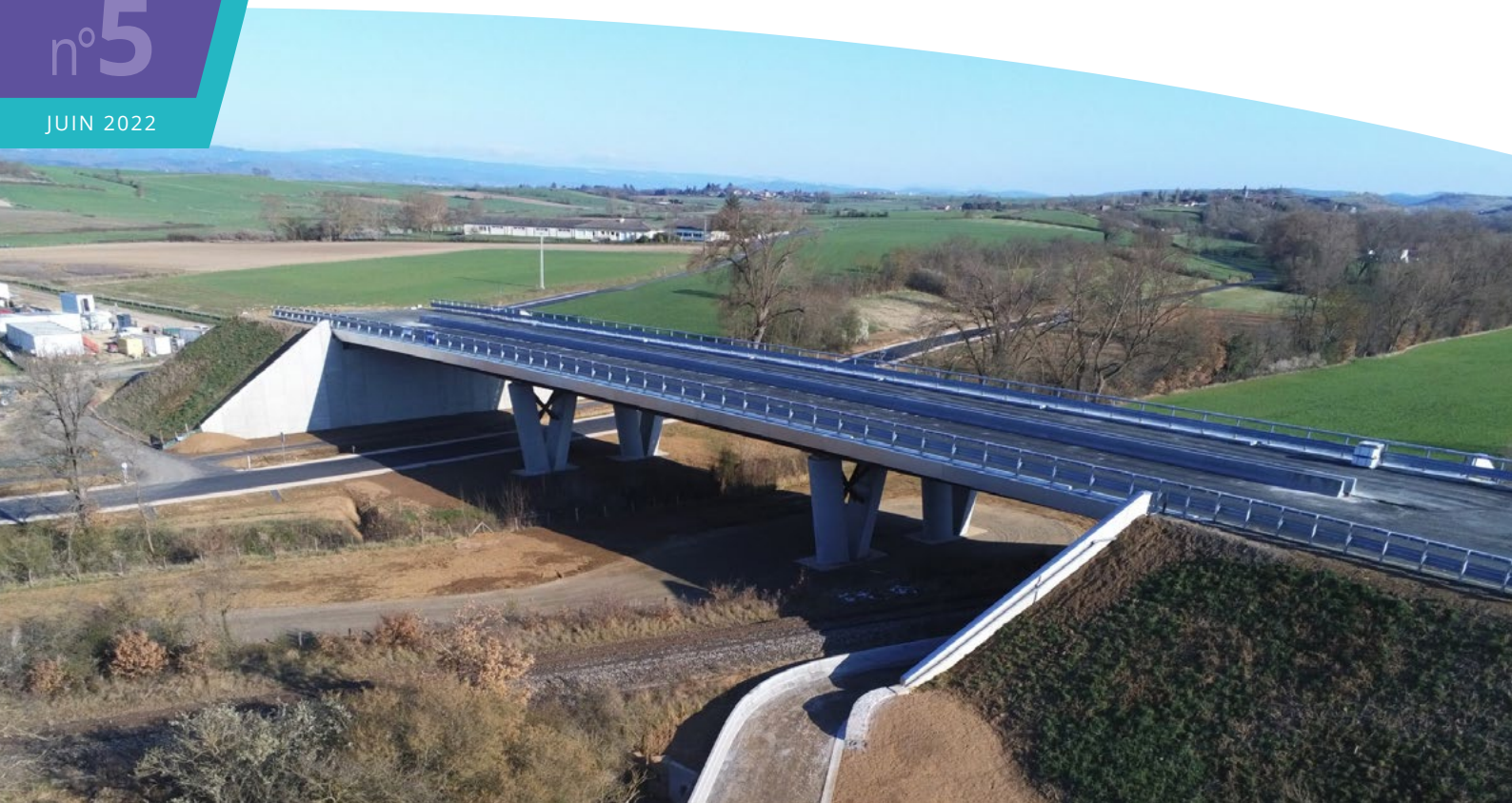
Depuis quelques semaines les usagers circulent sous le viaduc de la Leuge.