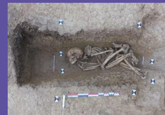
La sépulture d'un homme découverte au fond d'un fossé daté de l'Âge du bronze.

Sous la houlette de la Direction régionale des affaires culturelles (DRAC), c'est la société Paléotime, mandatée par la DREAL, qui a réalisé les fouilles. Les archéologues ont mis au jour des vestiges de fossés anciens, les traces de foyers à pierres chauffées, les fondations d'un bâtiment datant de l'époque antique, coupant elles-mêmes celles d'un ancien bâtiment gaulois. Dans les fossés, de nombreux fragments de vases et d'ossements ont été découverts : des crânes de bœuf, un crâne d'auroch, des côtes, des vertèbres mais aussi le corps inhumé d'un homme adulte, recroquevillé, déposé au fond de l'un des fossés.