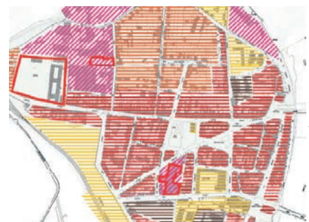
Étude urbaine sur Montauban «Typologie de l'occupation du sol sur les deux quartiers de Sapiac et Villebourbon.

Le taux de financement maximum est de 50 % (études), 40 % (travaux de prévention) et 25 % (travaux de protection).