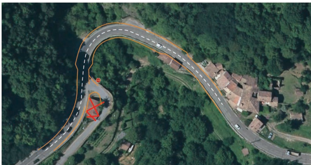
Plan schématique du scénario 4