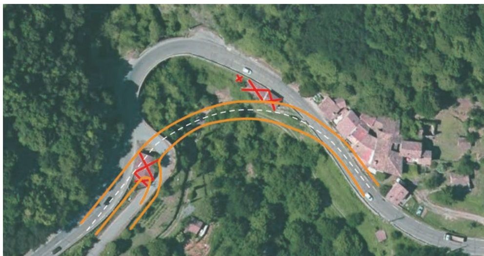
Plan schématique du scénario 5