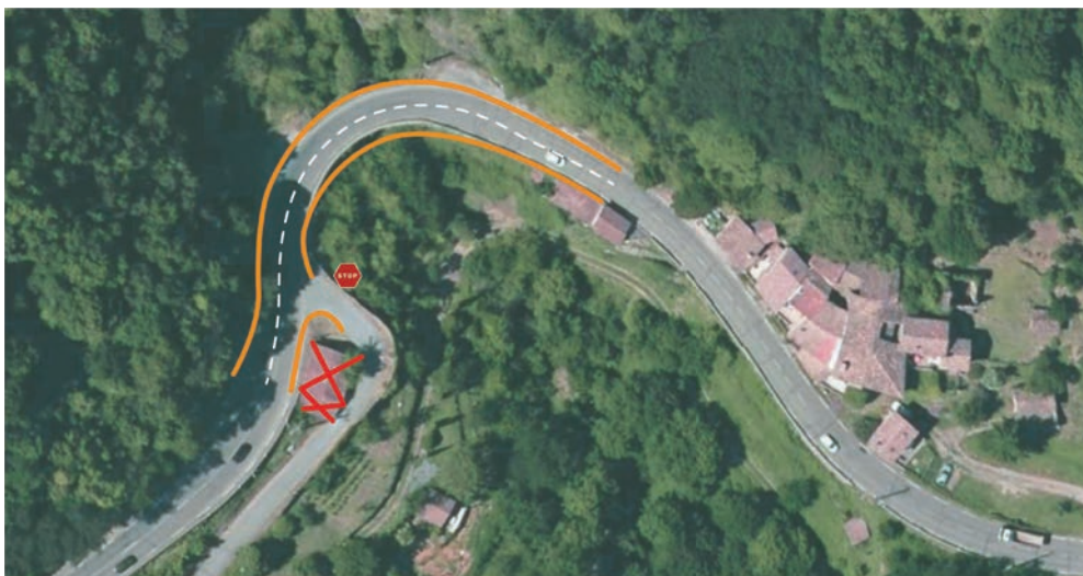
Plan schématique du scénario 1