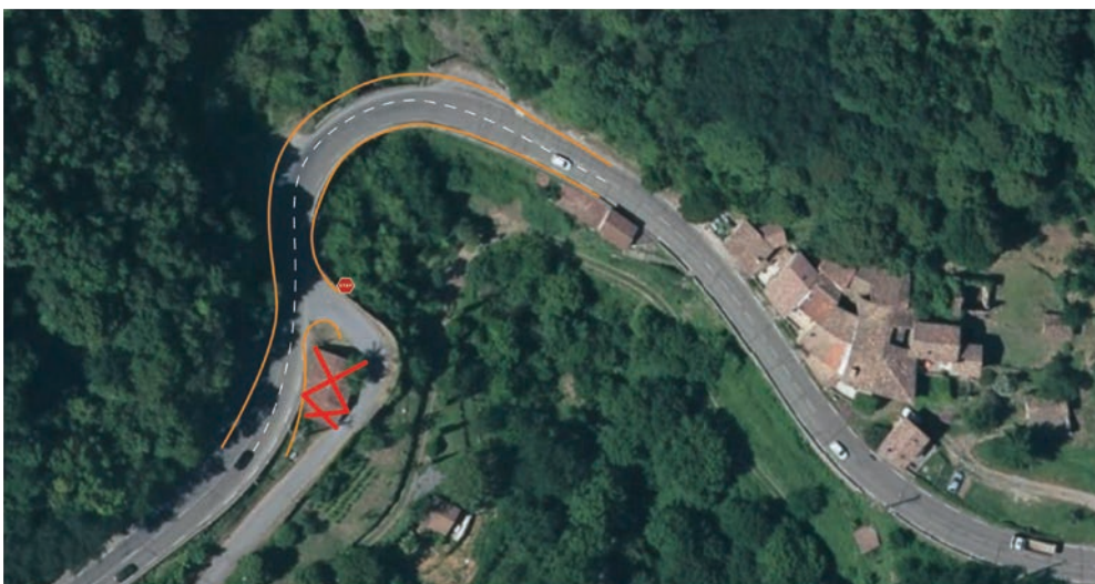
Plan schématique du scénario 2