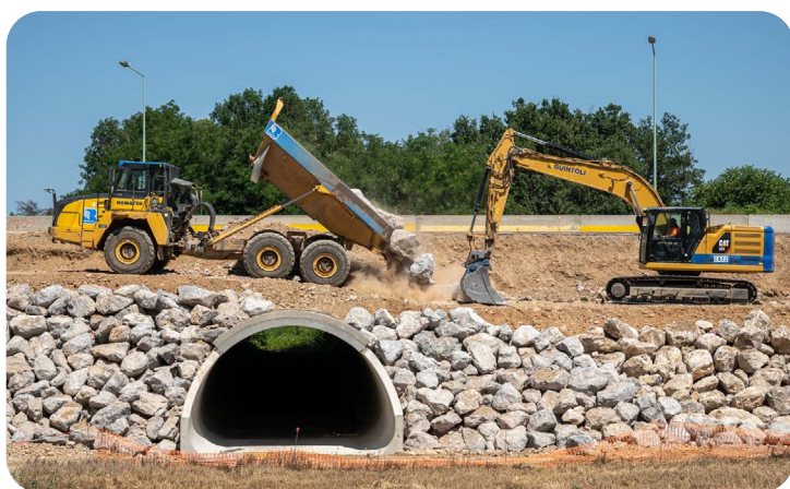
Élargissement d'un ouvrage hydraulique pour l'extension de la bretelle d'insertion sur la RN7 en direction du Sud

L'élargissement de la bretelle d'insertion vers le Sud s'est achevé en juillet. A terme, ce seront deux bretelles, l'une depuis le giratoire Boulle et l'autre depuis la RN7 Nord, qui se raccorderont à la RN7 Sud.