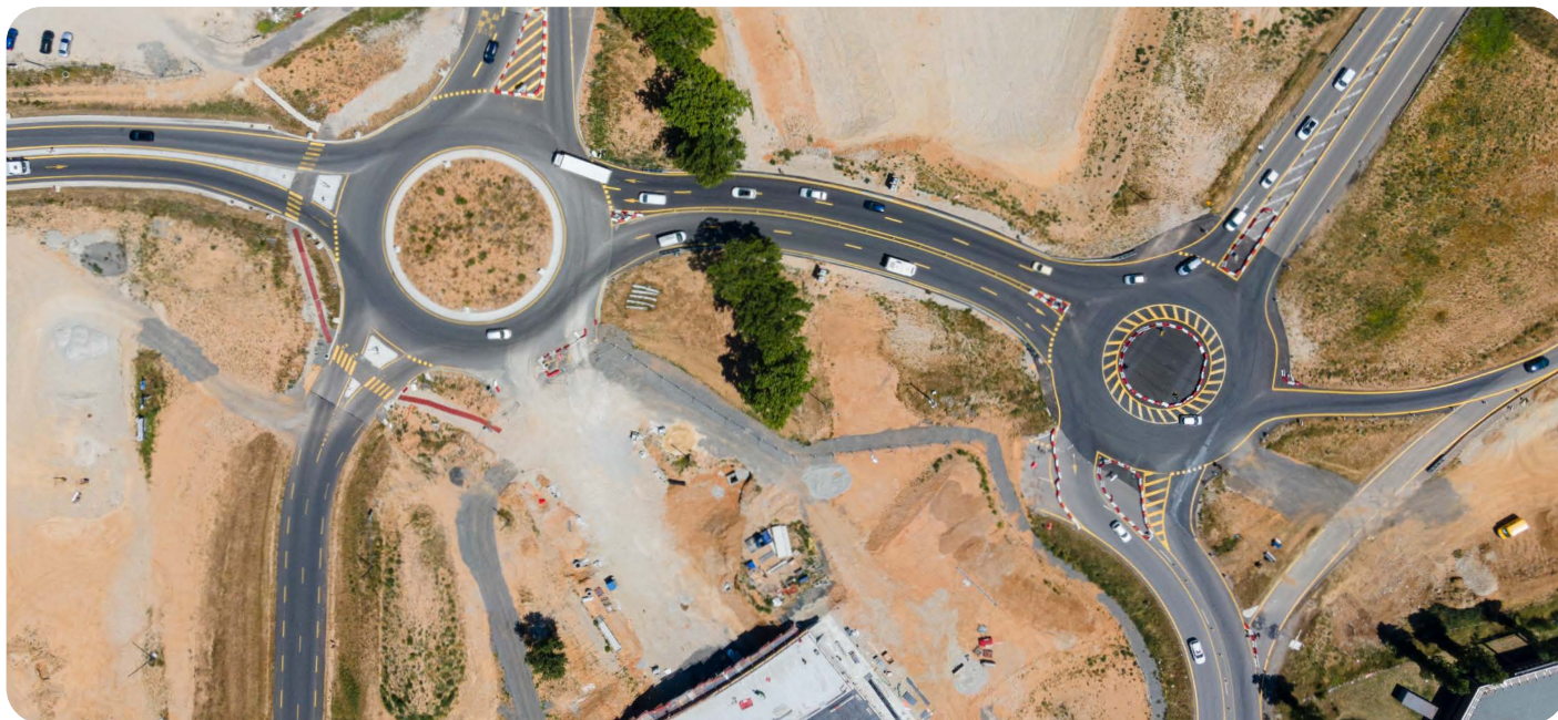
Vue aérienne du giratoire du Chantre (à gauche) et du giratoire provisoire (à droite) - juillet 2023