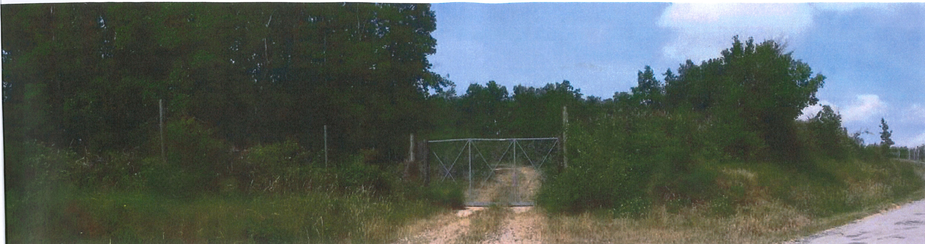
VUE A entree parcelle