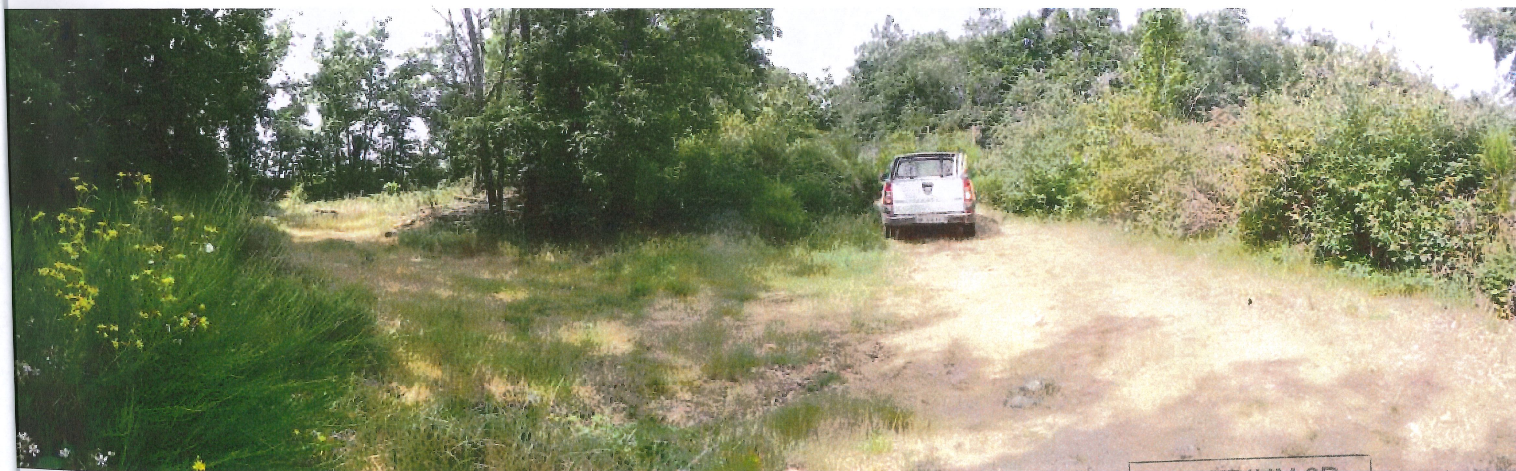
VUE B entree zone parking

ATRIUM 3D agence d'Architecture 15 Place des Cordeliers - 67100 ANNONAY Tél. : 04 75 67 50 58 - archi@atrium3d.fr Siret : 451 378 202 00019 - APE : 7111Z