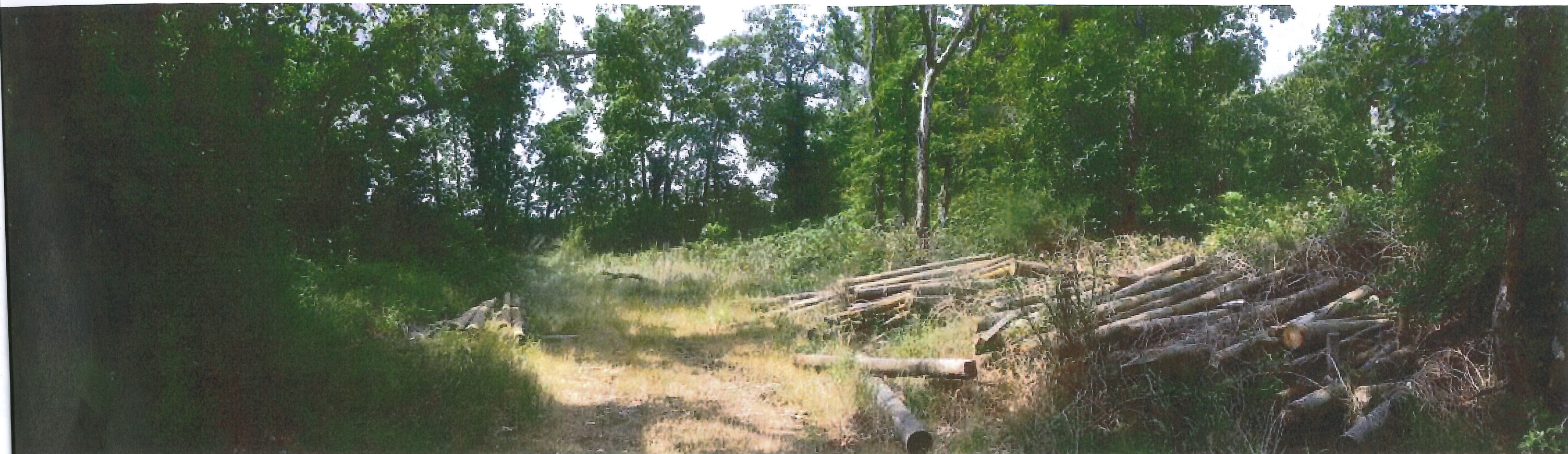
VUE C parking