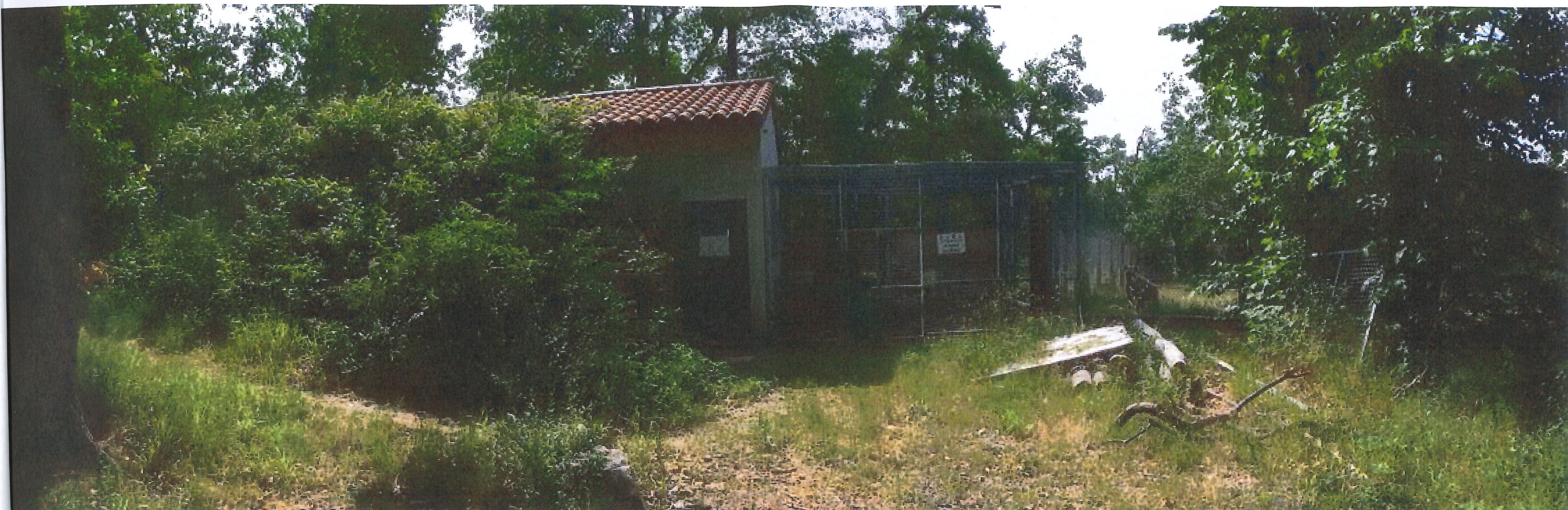
VUE G enclos des guepards