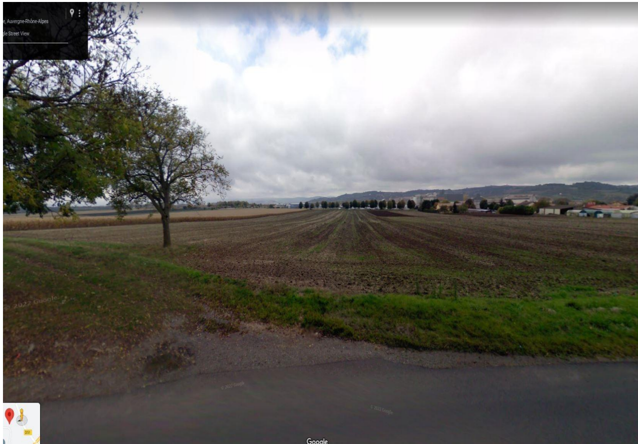
PC 7 - Photographie de près

16 Bis rue de la Gare 60430 St Sulpice Tel 06 59 62 45 26