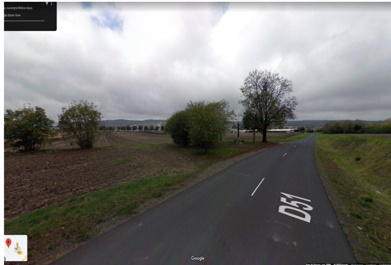
PC 7 - Photographie de loin