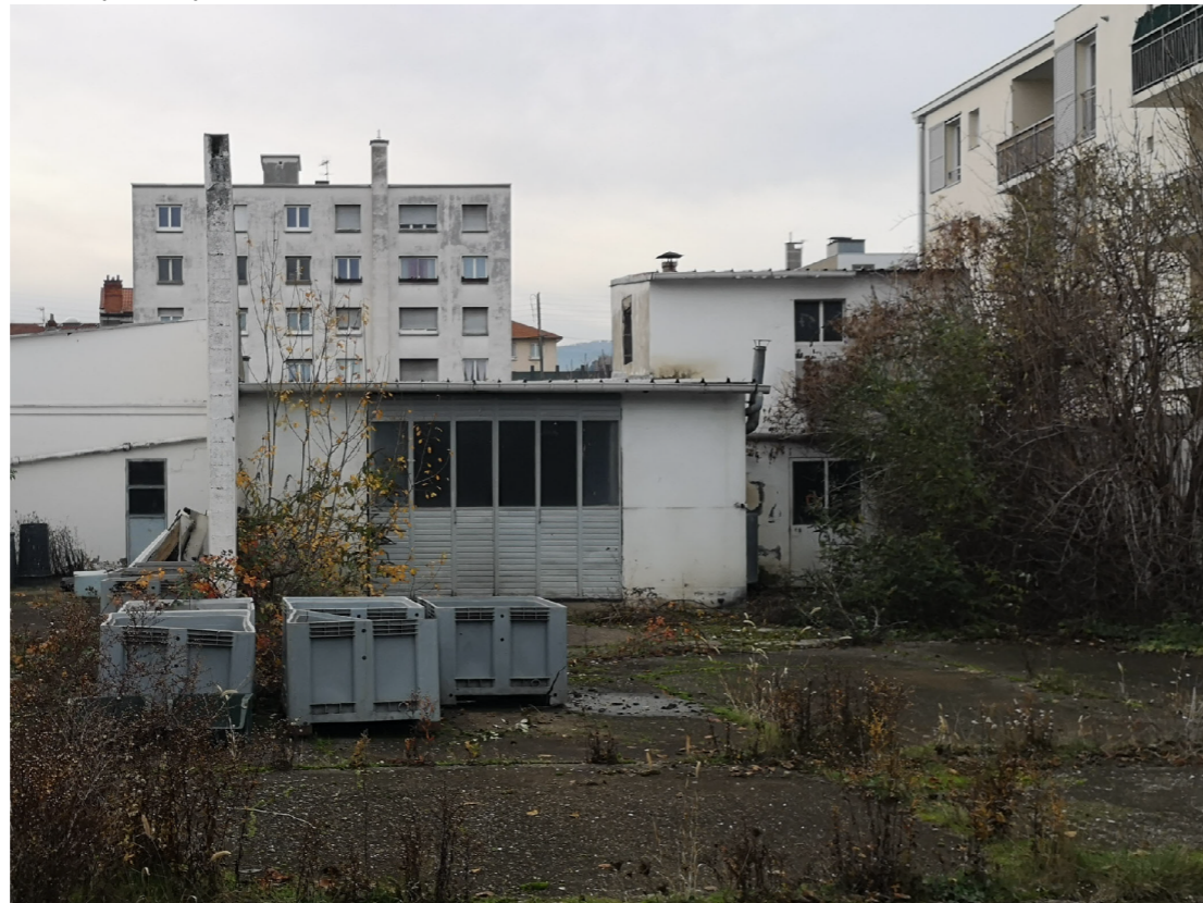
Vue depuis la parcelle 85