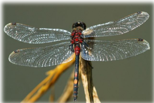
Leucorrhine douteuse ( Leucorrhinia dubia )

La Leucorrhine douteuse est une espèce des tourbières qui se développe dans les pièces d'eau oligotrophes sans poisson. Elle est confinée en Auvergne aux zones d'altitude avec