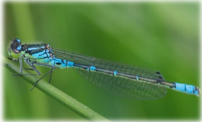
Agrion à lunules ( Coenagrion lunulatum )

L'Agrion à lunules est présent principalement dans le territoire du Parc naturel régional des Volcans d'Auvergne ; quelques stations subsistant dans le Livradois-Forez et en Margeride. En raison des risques qui pèsent sur ses milieux de développement (enrichissement, assèchement...) et de la fragilité des quelques noyaux de population, il est classé comme vulnérable. Près de 90 % des mailles 2 km x 2 km occupées par l'Agrion à lunules en France sont situées en Auvergne. La responsabilité de la région pour la conservation de cette espèce est donc très importante. Cette espèce a donc la priorité de conservation la plus forte (5) car sa disparition d'Auvergne signifierait probablement sa disparition du pays.