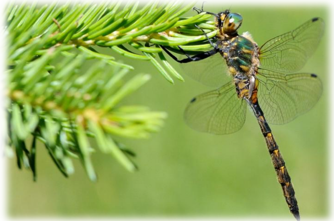
Cordulie à taches jaunes ( Somatochlora flavomaculata )