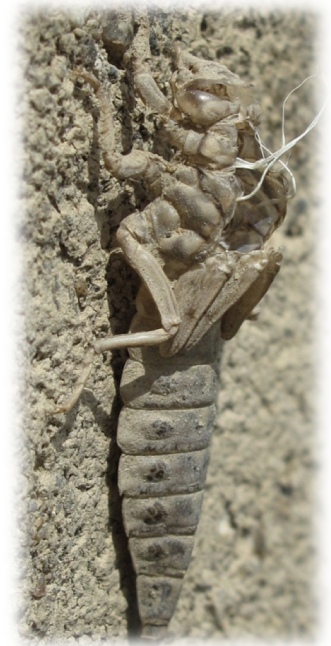
Exuvie de Gomphe à pattes jaunes ( Gomphus flavipes )

Le Gomphe à pattes jaunes est classé comme « En Danger » d'extinction en Auvergne en raison de sa présence restreinte uniquement à la partie aval du cours de l'Allier, et très ponctuellement de la Loire, seuls cours d'eau correspondant à ses exigences écologiques. Malgré cela, sa présence sur de nombreux cours d'eau en France et son classement comme « LC » au niveau national font que sa conservation n'est pas considérée comme prioritaire en Auvergne (1).