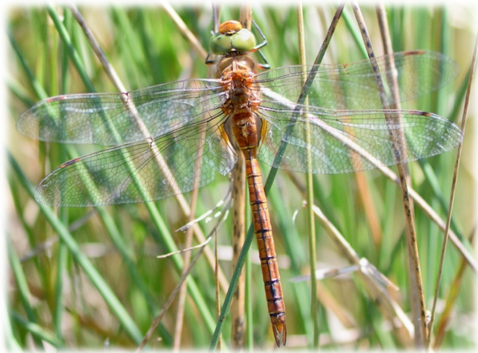
Aeshne isocèle ( Aeshna isocèles ) : une espèce à priorité de connaissances importante

En complément à ce travail, une évaluation des niveaux de priorité de conservation et de connaissance a été réalisée par l'application d'une méthode explicitée dans ce document. Ce travail complémentaire a vocation à servir d'outil d'aide à la décision et à la planification des actions d'étude et de conservation des odonates en Auvergne.