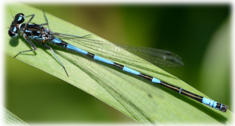
Agrion joli ( Coenagrion pulchellum )