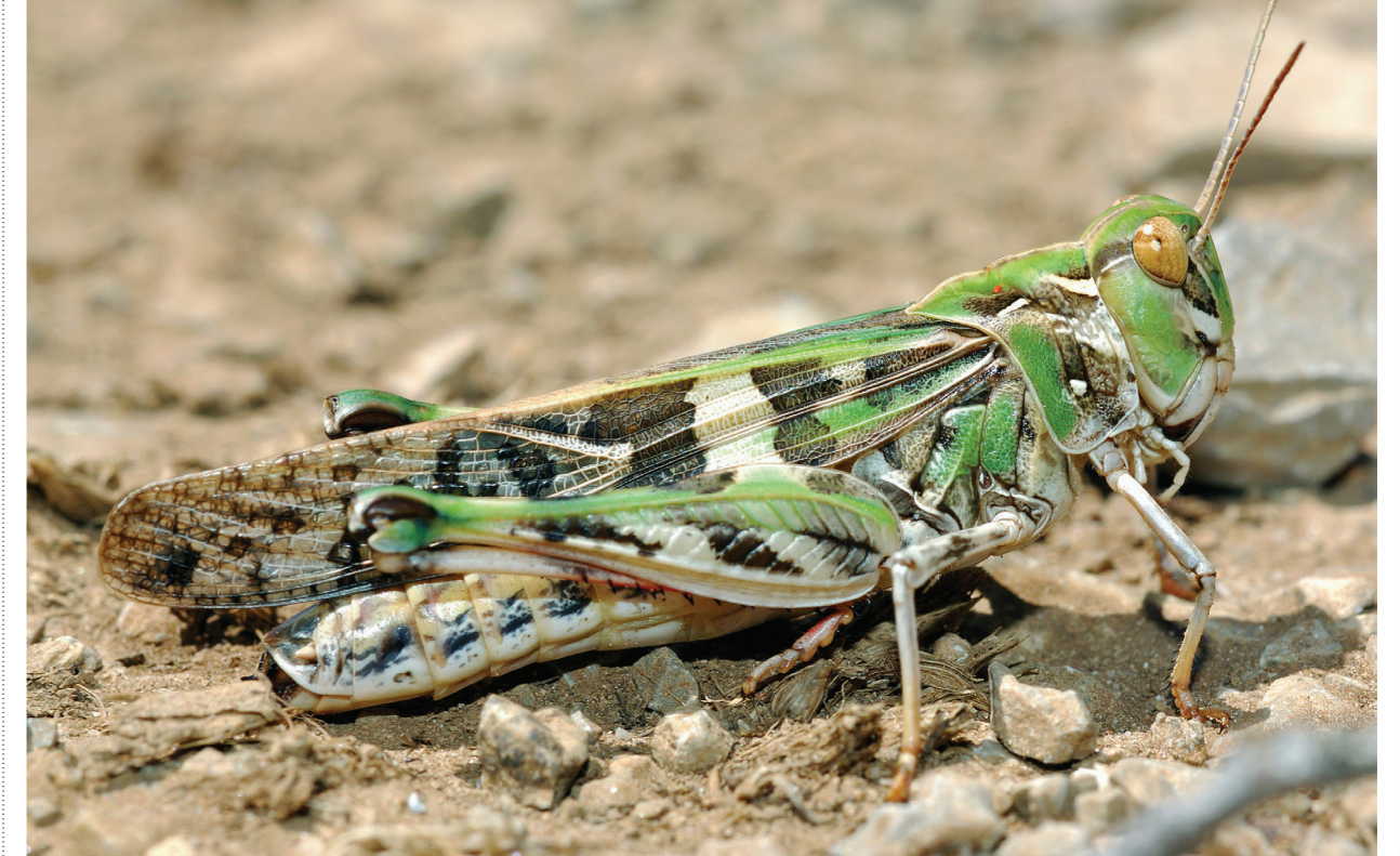
FIGURE 4 – Oedaleus decorus ♀

L'indice final obtenu est la somme de l'indice de rareté et de l'indice d'originalité (valeur maximale : 10). ■