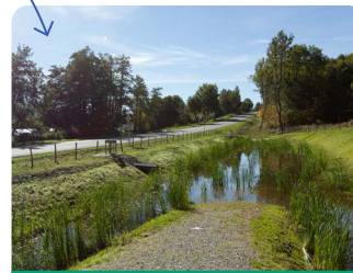
Bassin d'assainissement routier paysager