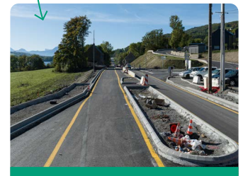
Travaux 2022 : aménagement du quai bus et de l'îlot devant la mairie