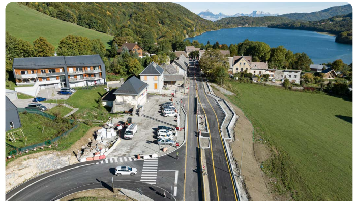
Été 2022 : aménagement du carrefour entre la Route du col (RD113B) et la RN85