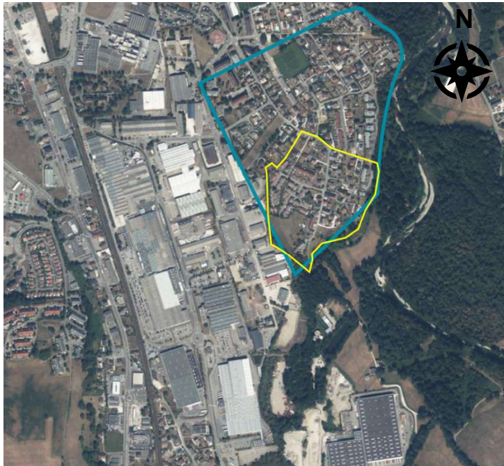
Figure 2 Localisation du secteur d'étude proposé par Tefal (en bleu) et au secteur de la ComCom/Antea (en jaune)