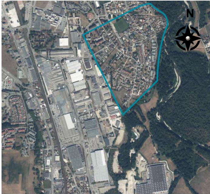
Figure 1: Localisation du secteur d'étude Tefal (en bleu)