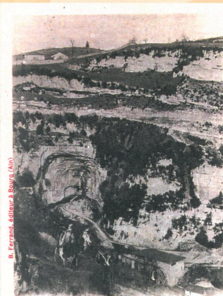
B. Ferrand, éditeur à Bourg (Ain)

L'aspergette, dont on ne voit pas les feuilles quand elle est en fleur !