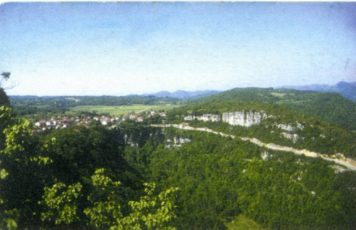
Le point de vue au lieu-dit Cbâtillon offre un magnifique panorama sur la reculée, le plateau de Corveissiat, le ruisseau de la Balme et les gorges de l'Ain.

Le massif de la grotte de Corveissiat est formé de roches calcaires, datées entre 150 et 170 millions d'années. Il présente des phénomènes souterrains et de surface caractéristiques d'un relief géomorphologique particulier : le karst* .