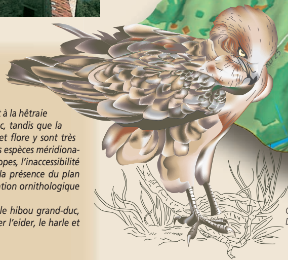
Circaète Jean-le-Blanc D'après Richard Harris Ching

D'après carte 1 : 25 000 © IGN, Paris Autorisation n°50-9015