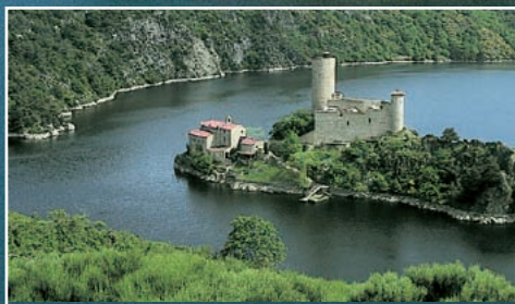
Le château de Grangent.