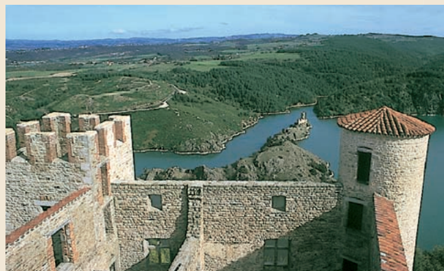
Le château d'Essalois dominant l'île et le château de Grangent.

Les gorges creusées par la Loire dans le plateau granitique sont naturellement devenues une voie de passage entre les bassins de l'Emblavès et du Velay, en amont, et la plaine du Forez, en aval. Les méandres du fleuve découpent toute une série de points stratégiques, occupés de très longue date comme en témoignent le dolmen des Échandès et l'oppidum d'Essalois. Plus tard, donjons et châteaux furent édifiés par chaque baronnie, chatellenie ou prieuré. Après des siècles mouvementés, le patrimoine historique et religieux des gorges de la Loire et de leurs abords reste d'une grande richesse. Essalois, Grangent, Chambles, Saint-Victor, Cornillon, le chapelet de sites historiques qui commence ici se prolonge en amont avec Arlempdes, Lavoulte et Polignac.