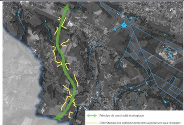
Le projet de modification est sans impact sur cette continuité écologique

Dans le Schéma Régional de Cohérence Ecologique, quels sont les éléments de la trame verte et bleue ? http://carto.datara.gouv.fr/1/dreal_nature_paysage_r82.map