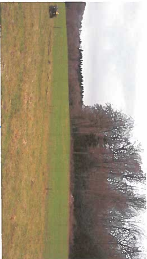
Vue 2 cembel de la garde