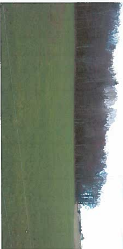
Vue 1 cembel de la garde