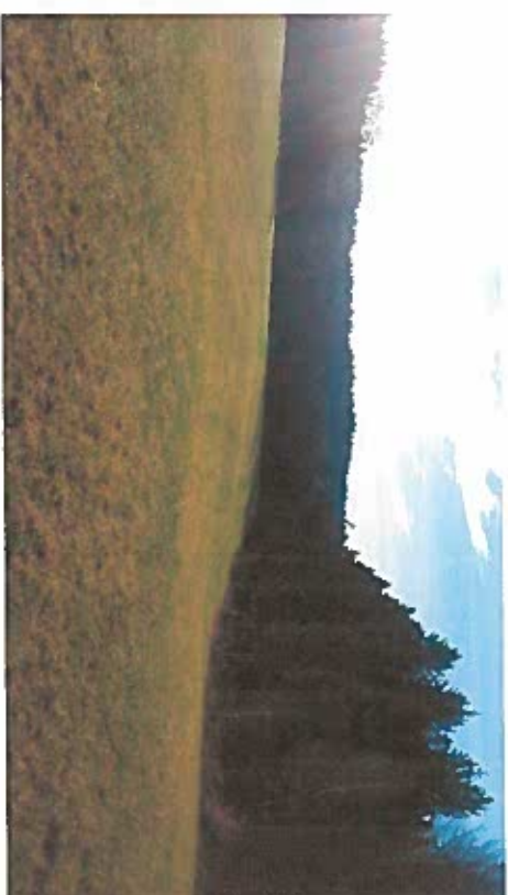
Vue 4 Baionnette