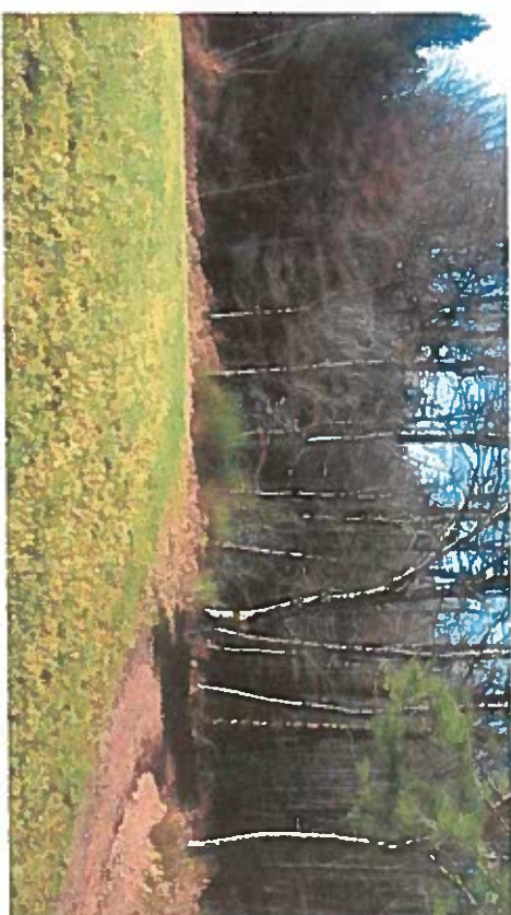
Vue 3 Baionnette