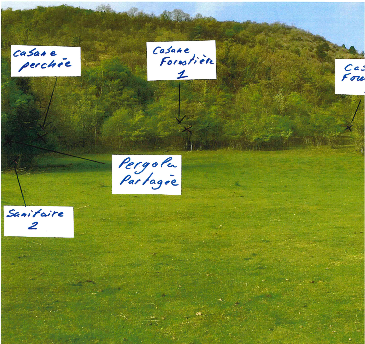
Aperçu de l'intégration Paysagère des

Photoprobe prise depuis bord de la voie communale distance 70m