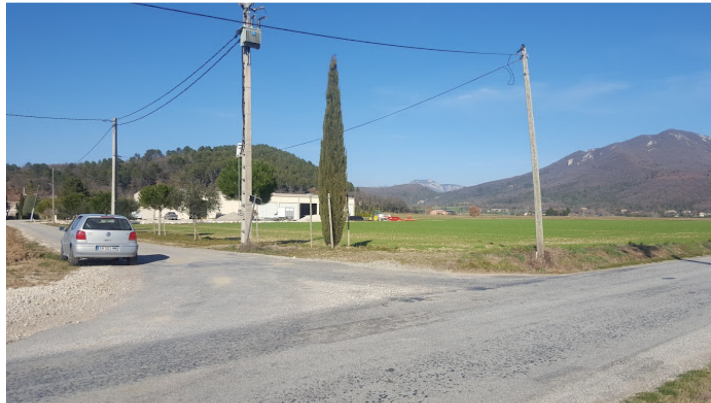
Vue PC7 / MARS 2019

(Repérage de prise de vue sur le plan-masse PC 2)