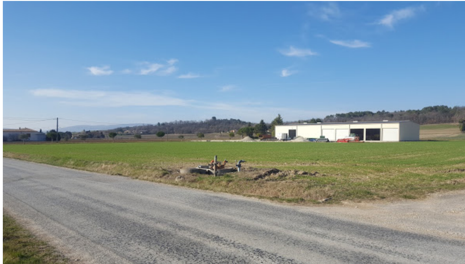
Vue PC8 / MARS 2019

(Repérage de prise de vue sur le plan de la parcelle PC 2)