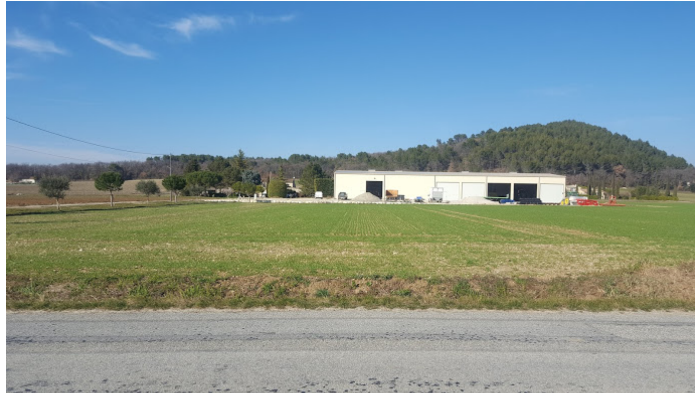
Vue PC6 / MARS 2019

(Repérage de prises de vue sur le plan-masse PC 2)