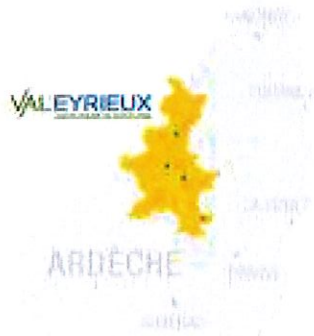
Fig. n°1 - Localisation de la communauté de communes VAL'EYRIEUX dans le département de l'Ardèche.

Ce dossier concerne en effet seulement une partie des communes de la CC. VAL'EYRIEUX (14 communes sur les 31) puisque celle-ci exerçait, jusqu'au 1 er janvier 2016, les compétences eau et assainissement des eaux usées uniquement sur ces 14 communes. Depuis cette date, la CC. VAL'EYRIEUX est compétente en matière d'eau potable et d'assainissement pour l'ensemble de son territoire (31 communes).