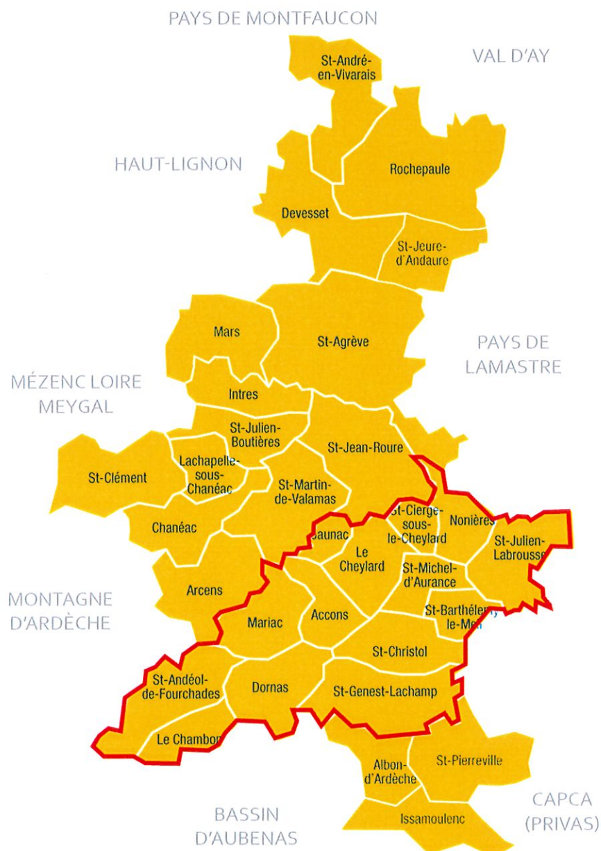
Fig. n°2 - Localisation des 14 communes au sein de de la communauté de communes VAL'EYRIEUX.

Sur ce secteur, 4 communes utilisent un réseau de collecte et une station d'épuration intercommunale (en bleu sur la figure n°3), 3 disposent de leur propre système d'assainissement (en vert) et 7 n'ont pas de système d'assainissement collectif.