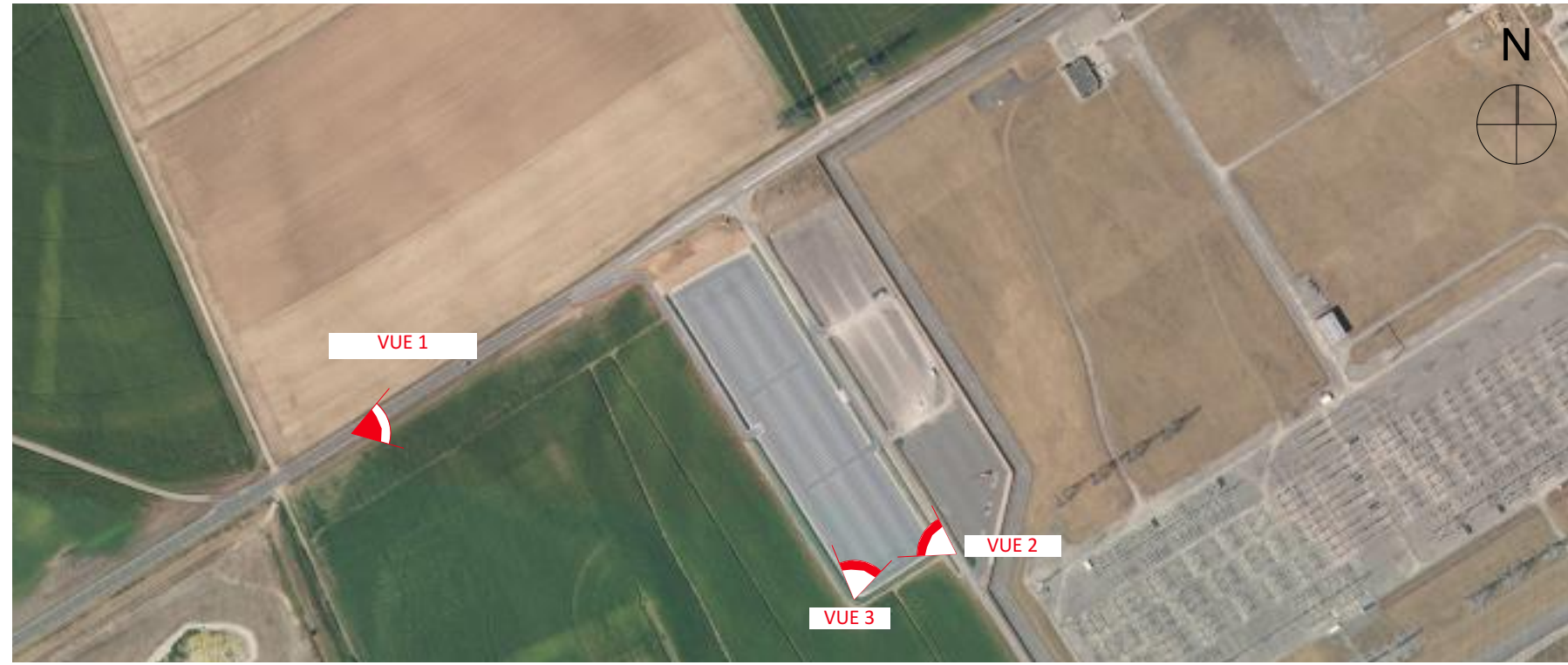
SITUATION DES PRISES DE VUES