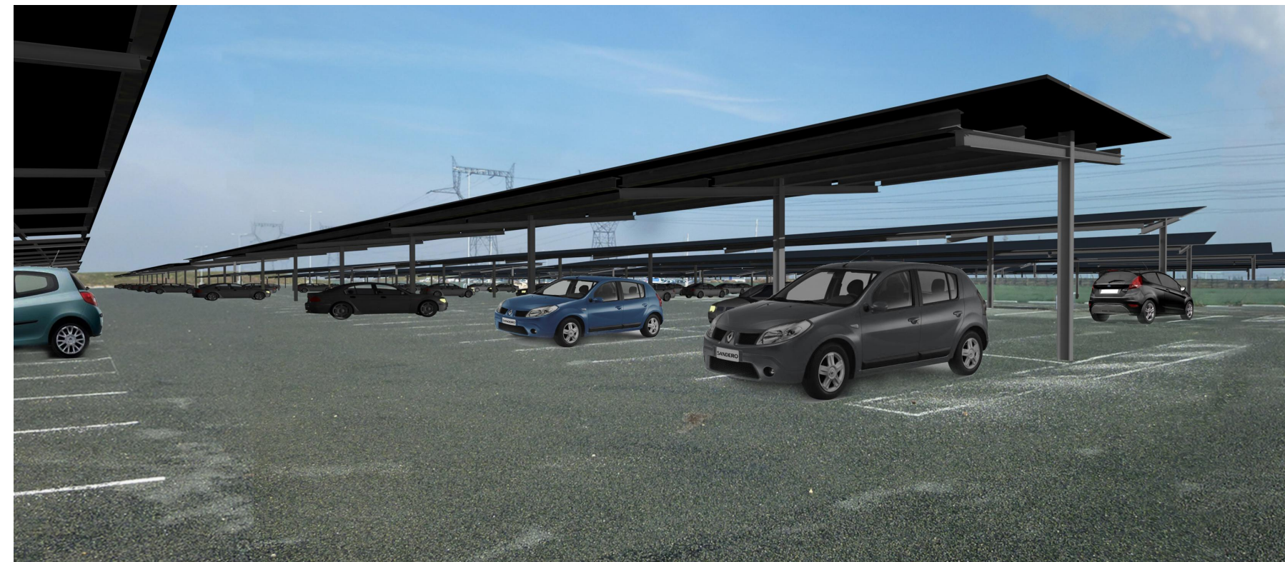
PC6 - vue 3- Document graphique d'insertion du projet

Les plans du présent dossier ne sont pas des plans d'exécution. Ils devront faire l'objet d'études approfondies en vue de la construction. Les surfaces restent à vérifier et seront affinées lors des phases de projet ultérieures.