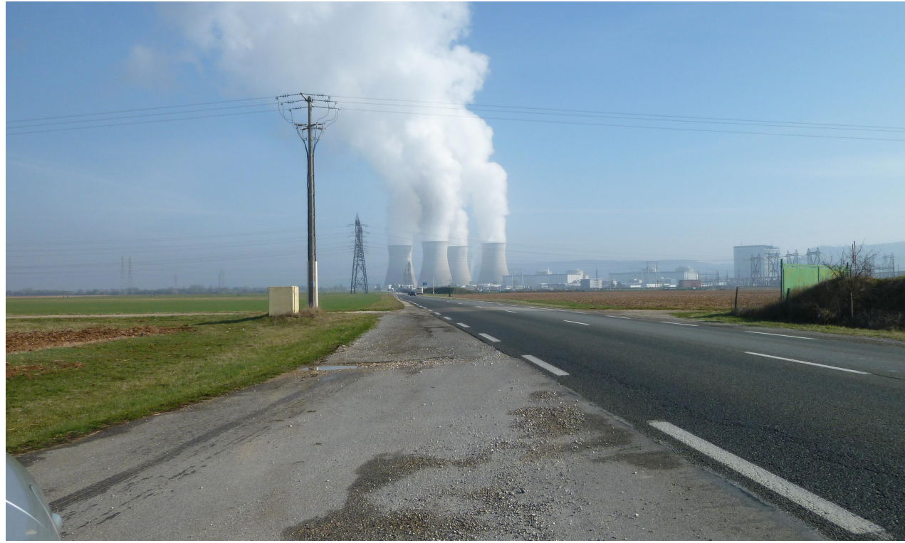
PC8 - vue 1- Situation du terrain dans le paysage lointain