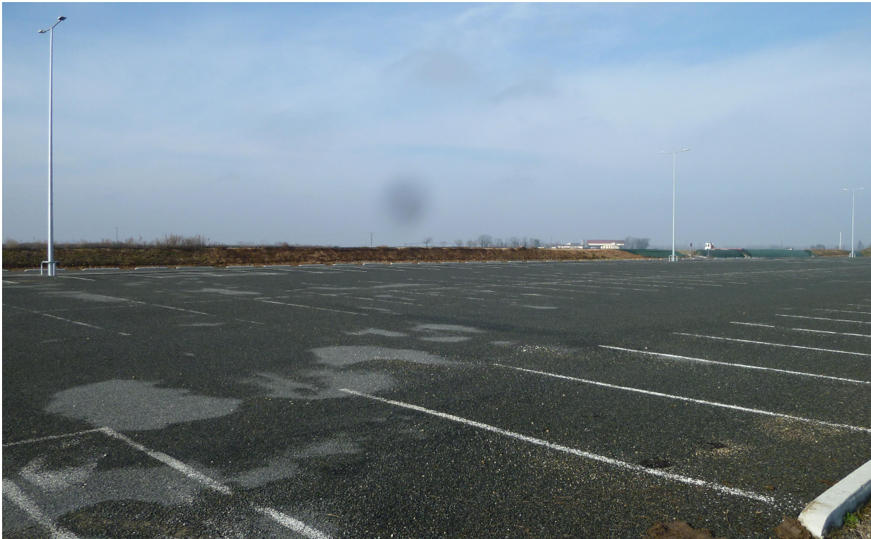
PC7 - vue 2- Situation du terrain dans le paysage proche