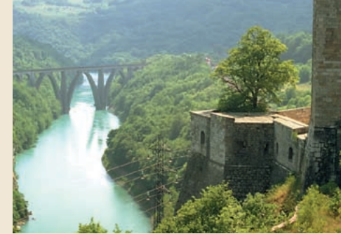
Le défilé vu depuis le belvédère de Léaz (à gauche) et depuis le fort (à droite).

Enfin, depuis le pont Carnot sur lequel la RN206 franchit le Rhône, on comprend le rôle stratégique du fort, contrôlant le passage sur la rive droite du fleuve.