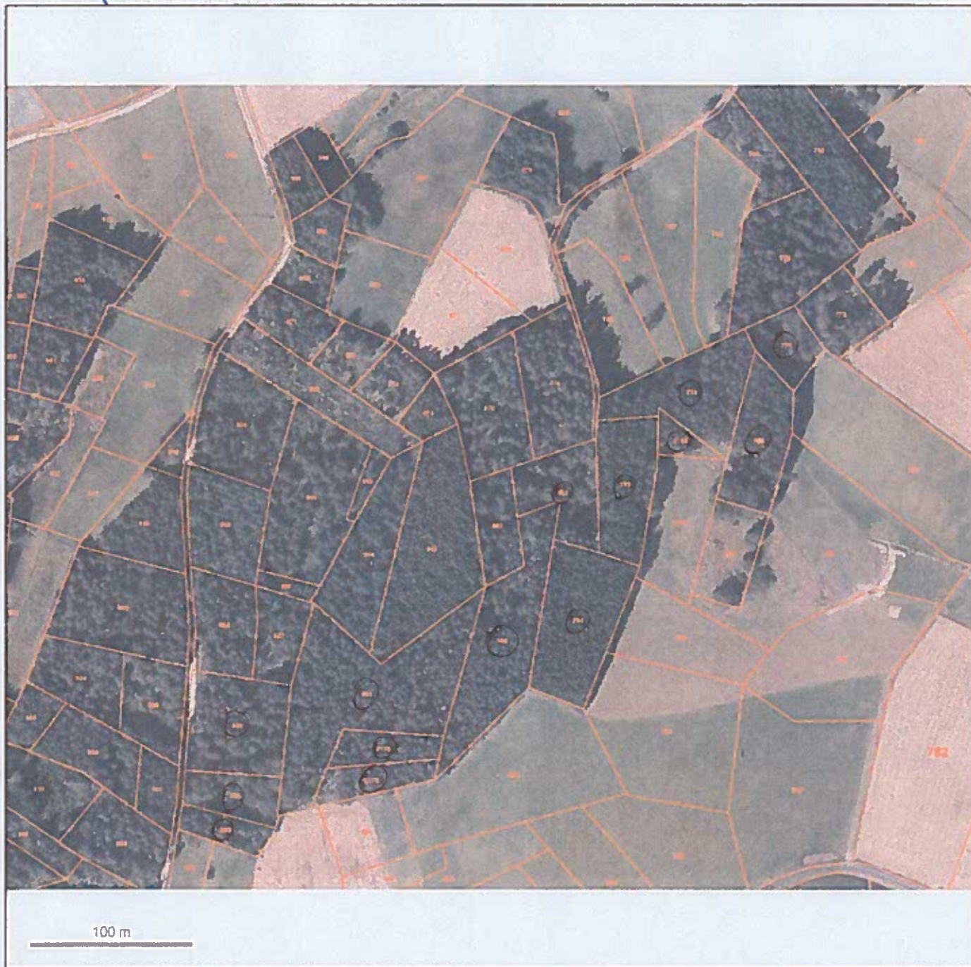
Photo aérienne géoportail de 2012. les parcelles à défricher sont entourées.