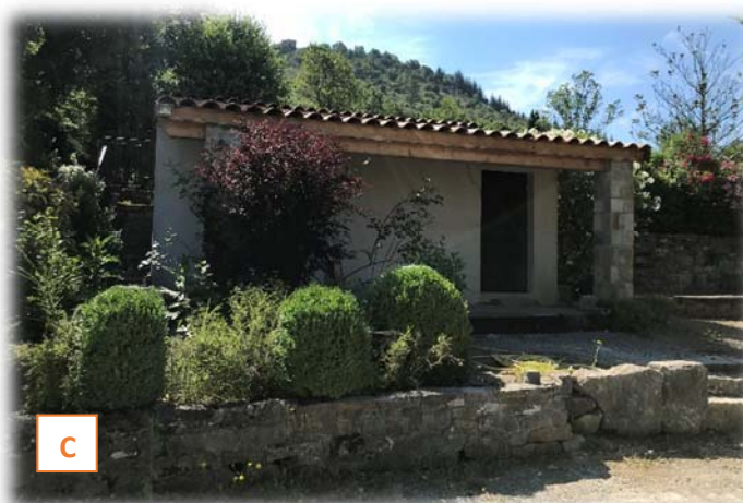
Prise du vue C : sanitaires existants (cliché IATE du 25/06/2020)