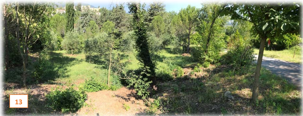
Prise de vue n°13 : Une des faysses vue depuis la partie haute du domaine