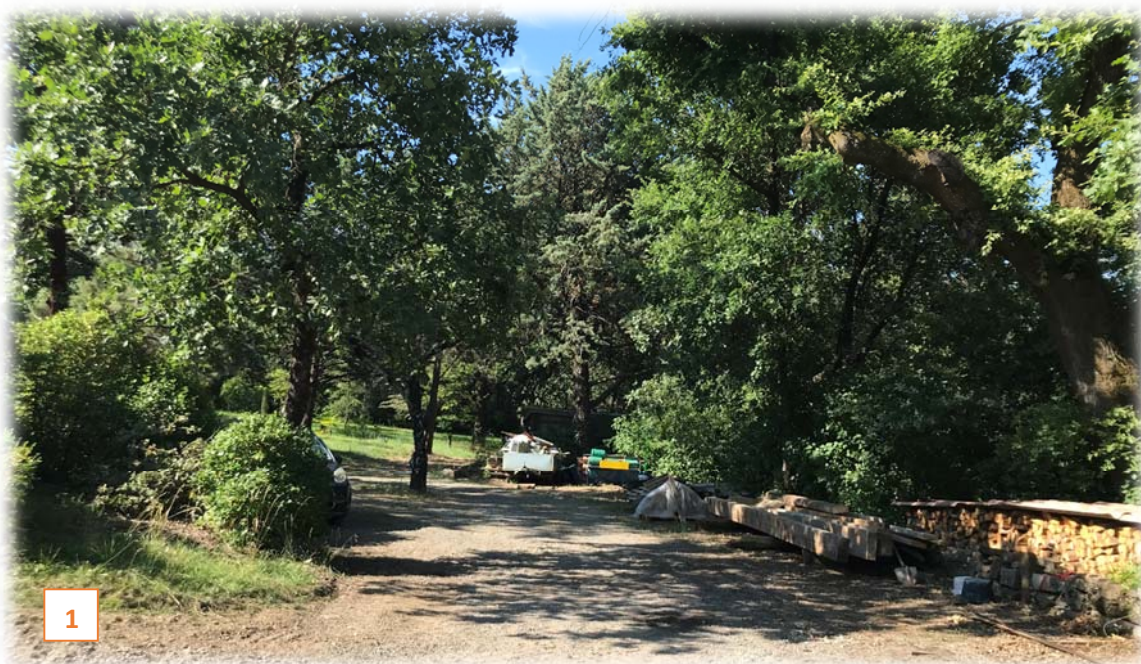
Prise de vue n°1 : vers l'entrée principale projetée : nouvel accès à créer depuis la route de la zone d'activités de Champ Vert (cliché IATE du 25/06/2020)