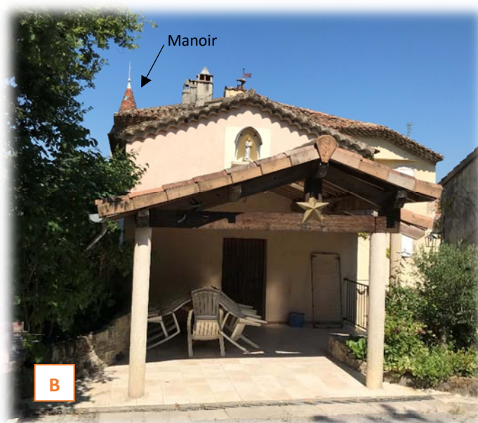
Prise du vue B : ancienne chapelle réaménagée en gîte (cliché IATE du 25/06/2020)