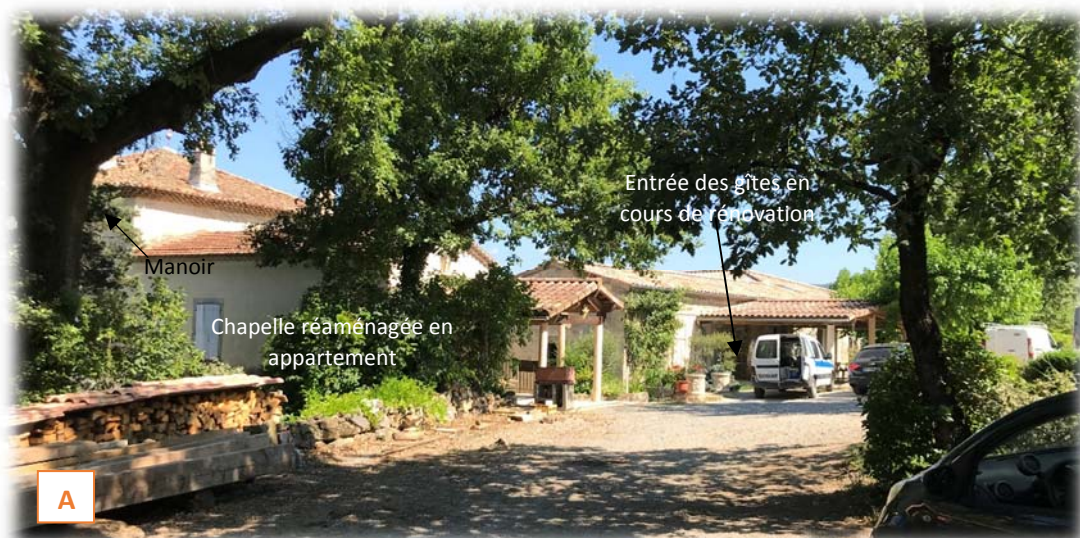
Prise du vue A : bâtiments existants attenants au manoir (cliché IATE du 25/06/2020)