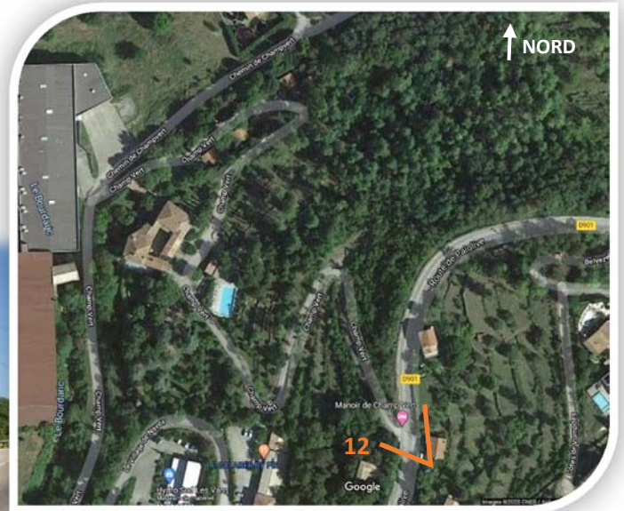
Photographie aérienne du site