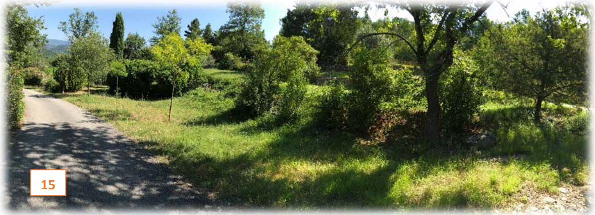
Prise de vue n°15 : Panorama d'une succession de belles faysses à aménager