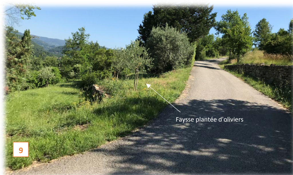
Prise de vue n°9 : route de desserte du domaine