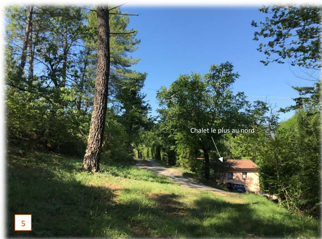
Prise de vue n°4 : accès aux 5 chalets historiques existants sur la partie basse du domaine, côté nord-ouest