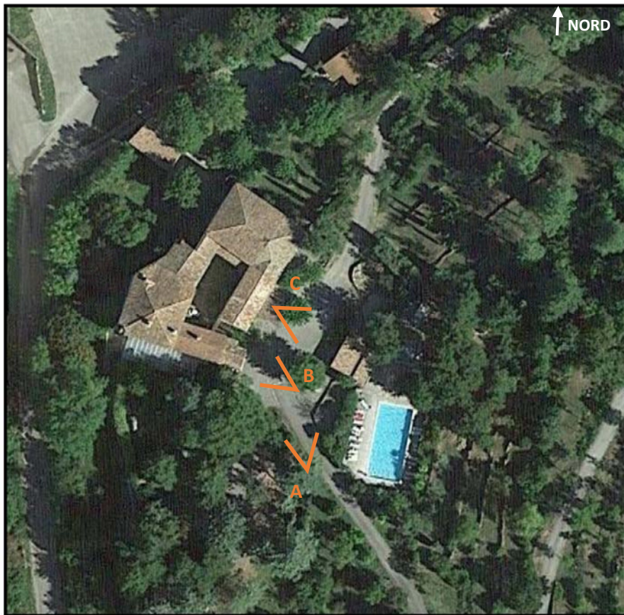
Localisation des prises de vue des photos des bâtiments existants du manoir