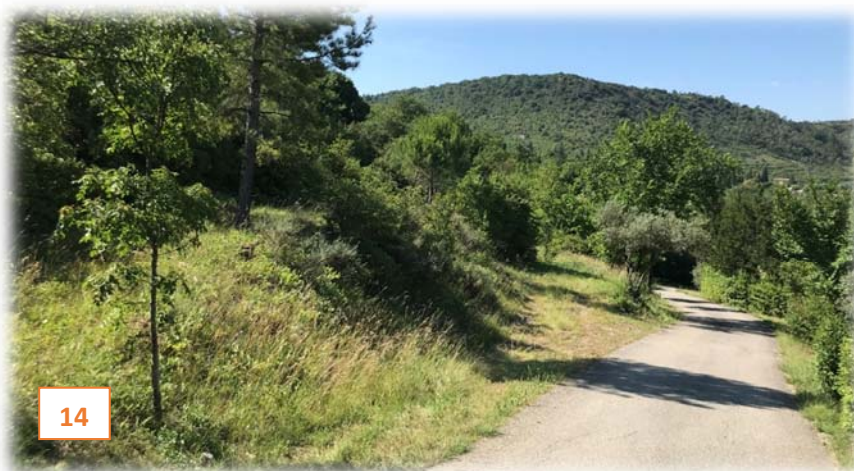
Prise de vue n°14 : petite fayesse enherbée