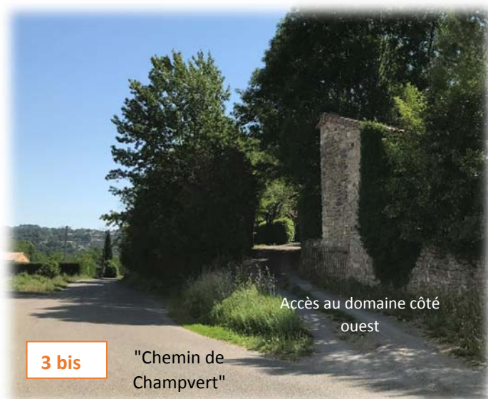
Prises de vue n°3 et 3 bis : entrée actuelle en bas du domaine côté ouest, donnant sur la route "Chemin de Champvert" (cliché IATE du 25/06/2020)