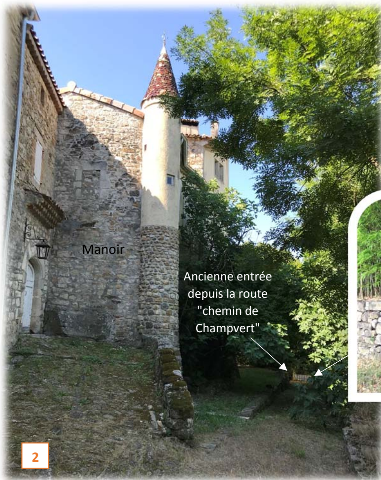
Prise de vue n°2 : ancienne entrée historique du site en bas du domaine côté ouest