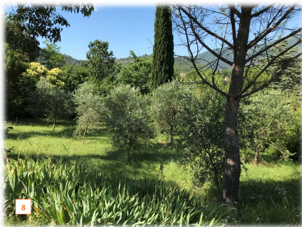
Prise de vue n°8 : une des nombreuses faysses du domaine, plantée d'oliviers