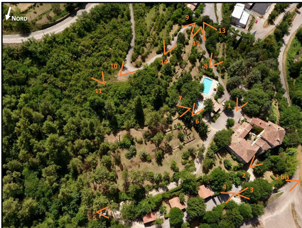
Localisation des prises de vue sur photographie vue du ciel du domaine du Manoir de Champvert