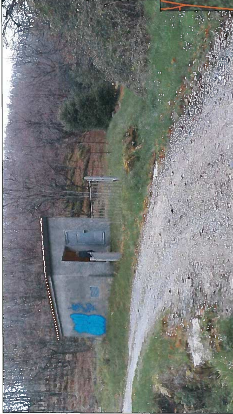
Photo 1 : Vue de l'accès au PPI du forage actuel d'Aigues Freydes et du bâtiment technique du forage.