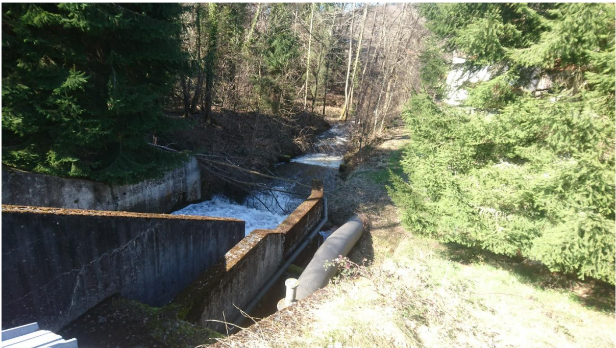
Fig. 4. Coursier béton du seuil de déversement en aval de la retenue