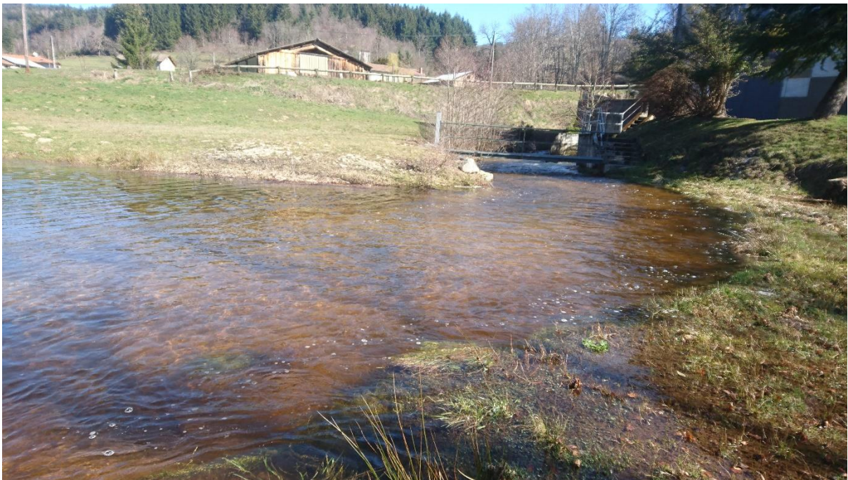
Fig. 2. Connexion ruisseau de Grandrif / Retenue de Barot