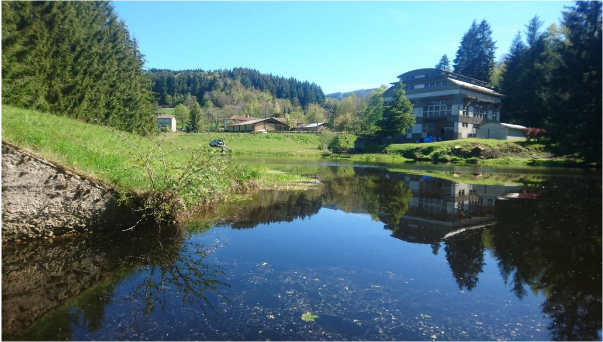
Fig. 3. Retenue du barrage de Barot et bâtiment-usine de Grandrif