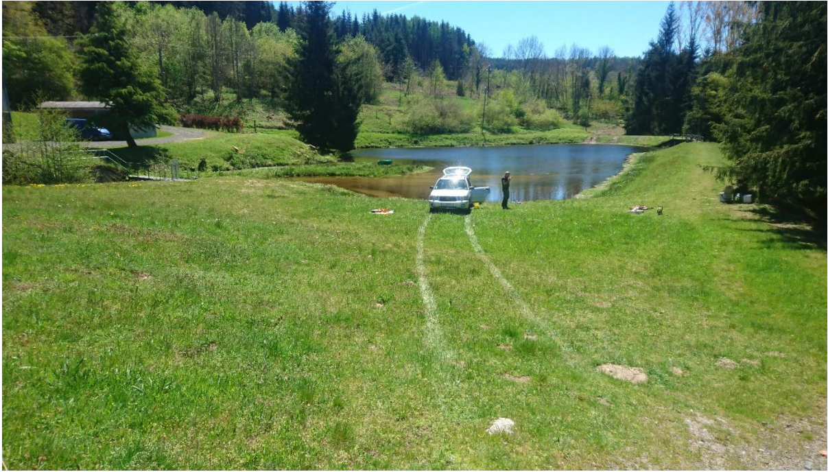
Fig. 1. Accès à la retenue