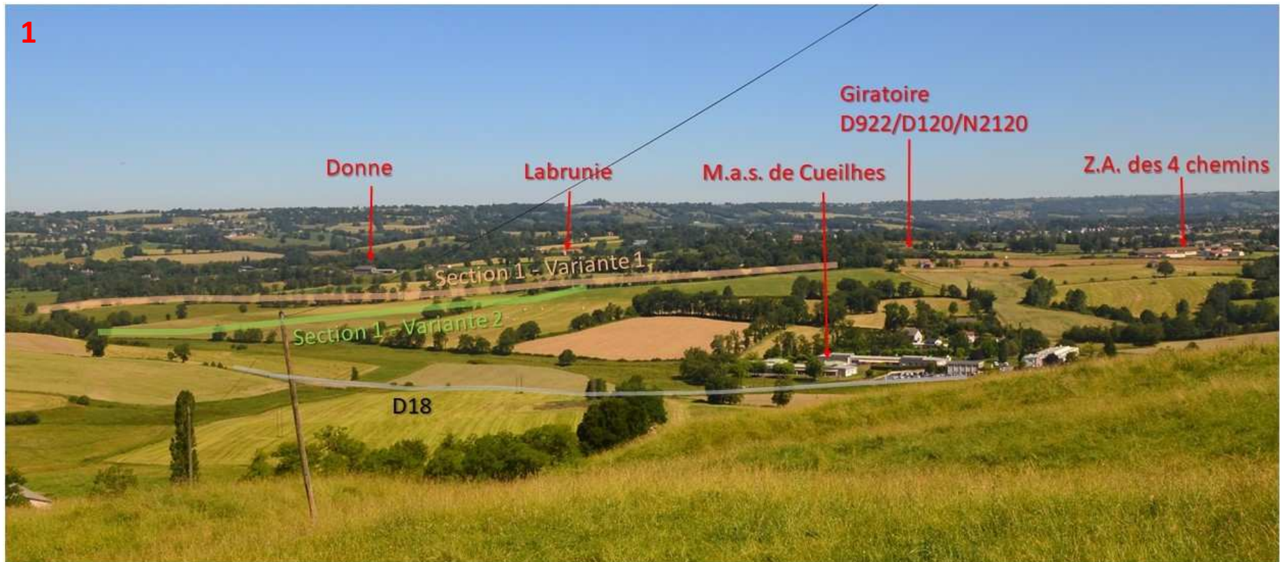
Annexe 3 - 1/5 : Photo 1/4 d'implantation du projet depuis Aurillac (Est Belbex) - source : OGI, été 2018