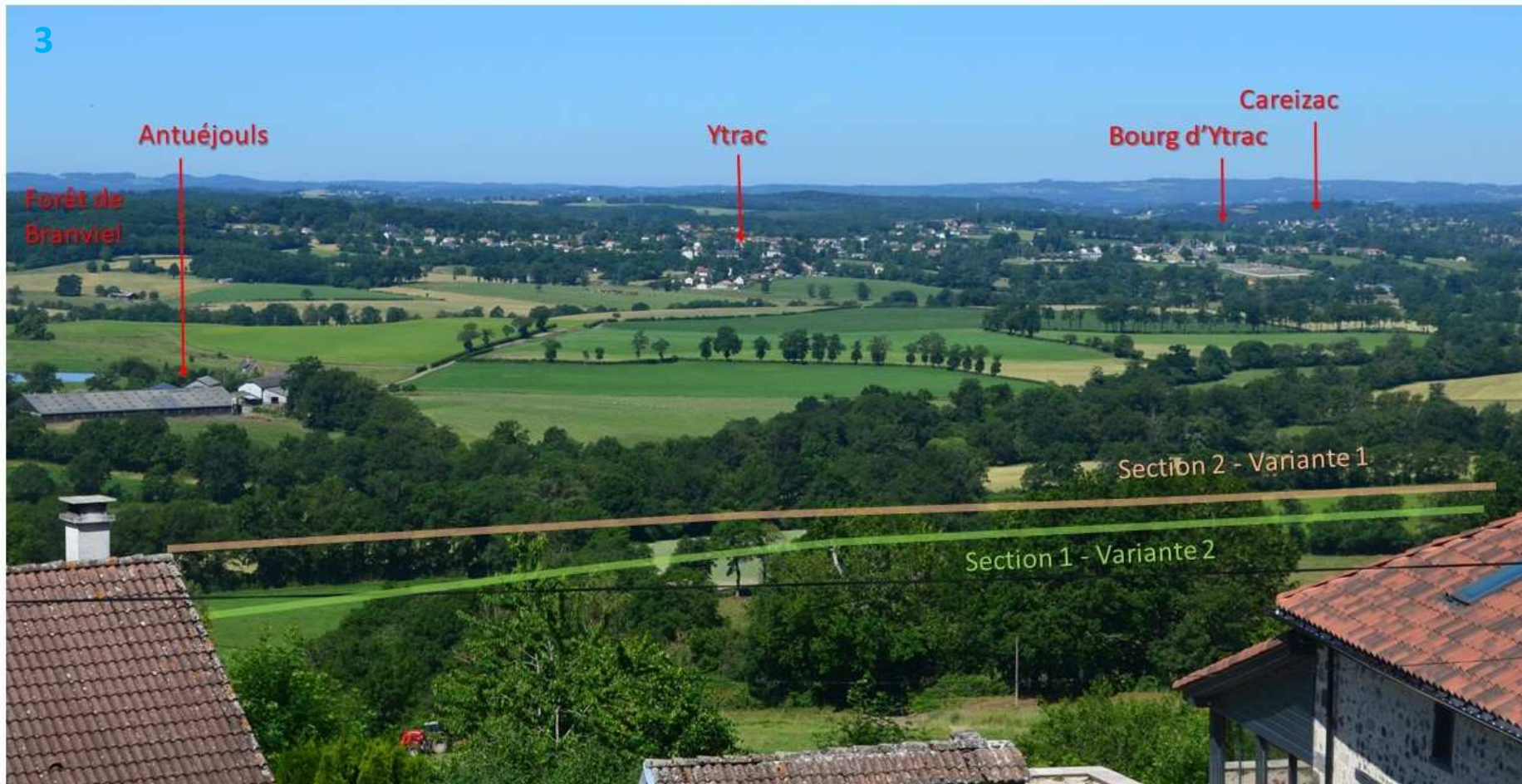
Annexe 3 - 3/5 : Photo 3/4 d'implantation du projet depuis Aurillac (vieux Belbex) - source : OGI, printemps 2018