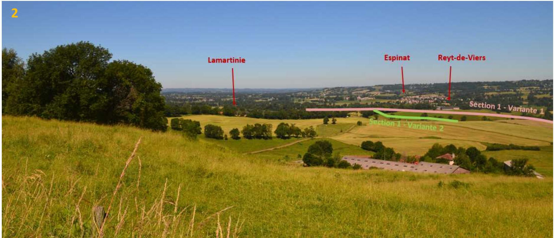
Annexe 3 - 2/5 : Photo 2/4 d'implantation du projet depuis Aurillac (Est Belbex) - source : OGI, été 2018