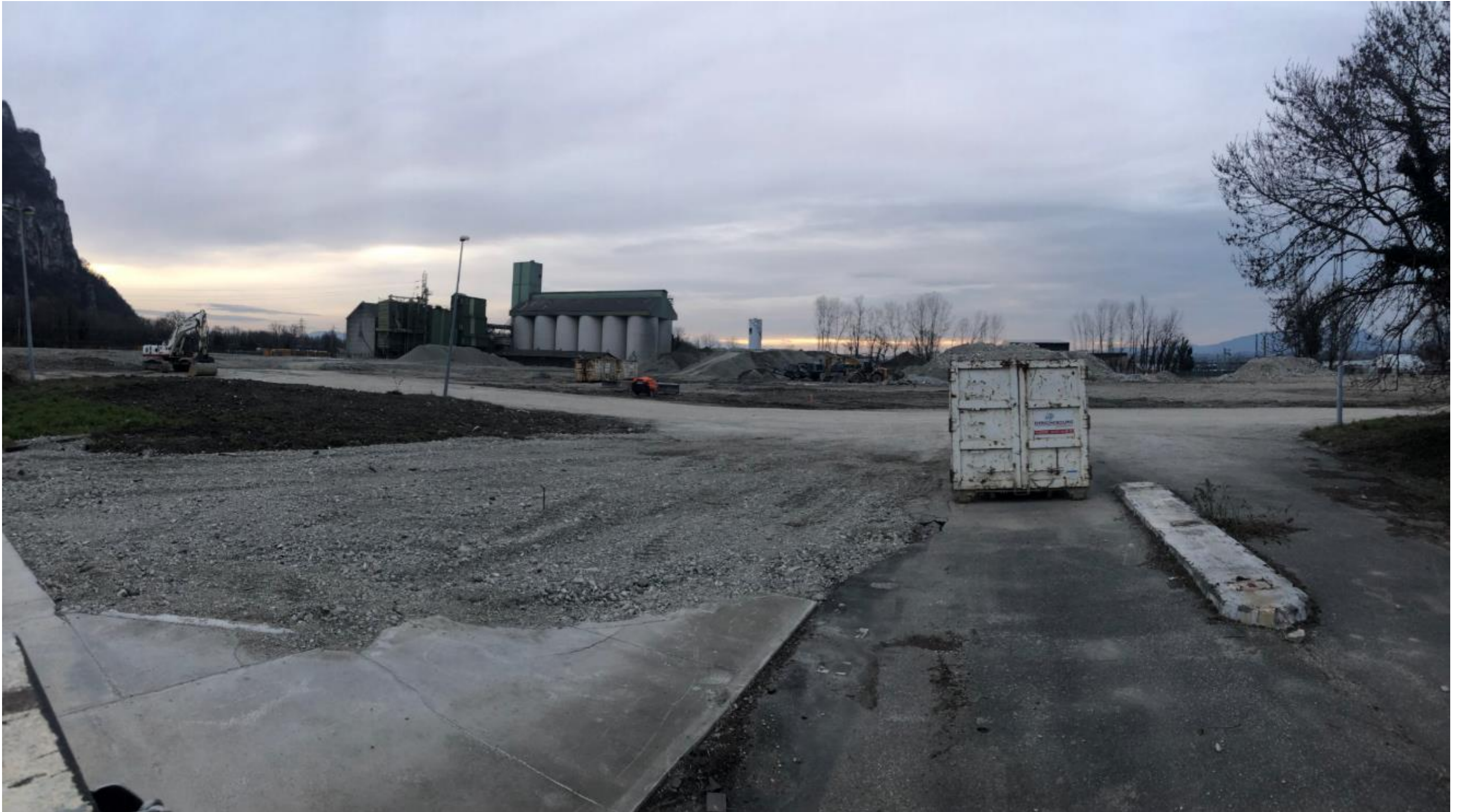
Prise de vue 2 – Février 2021