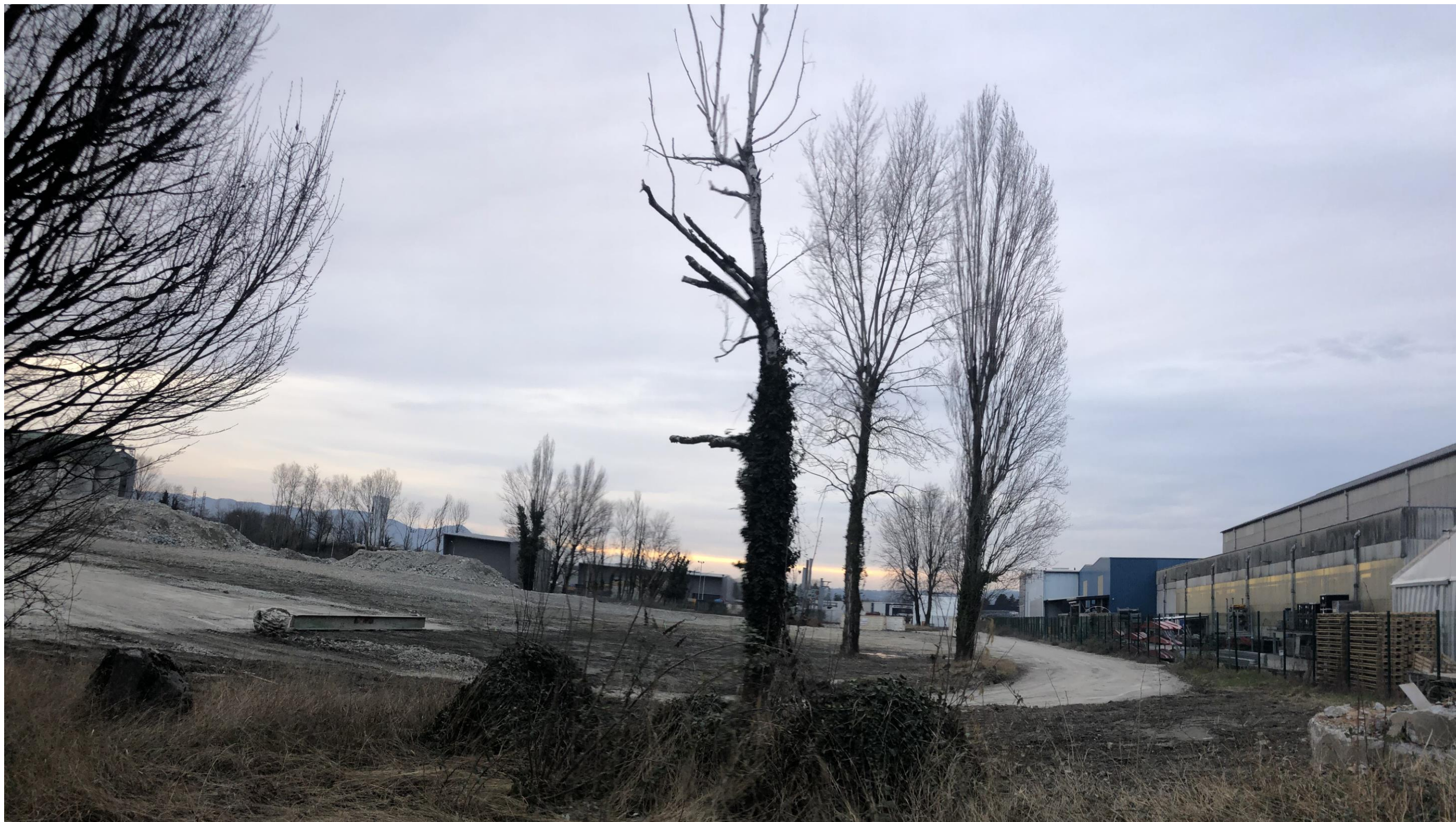
Prise de vue 1 – Février 2021