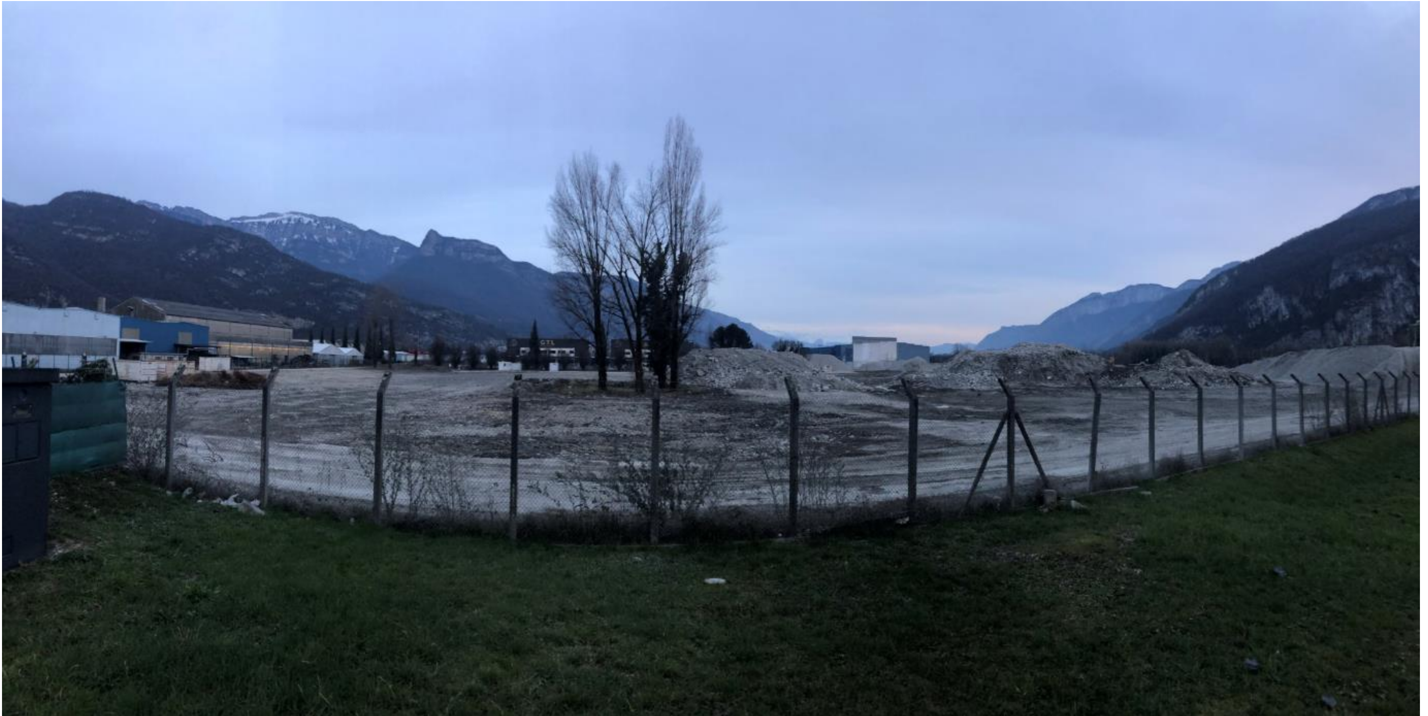
Prise de vue 5 – Février 2021