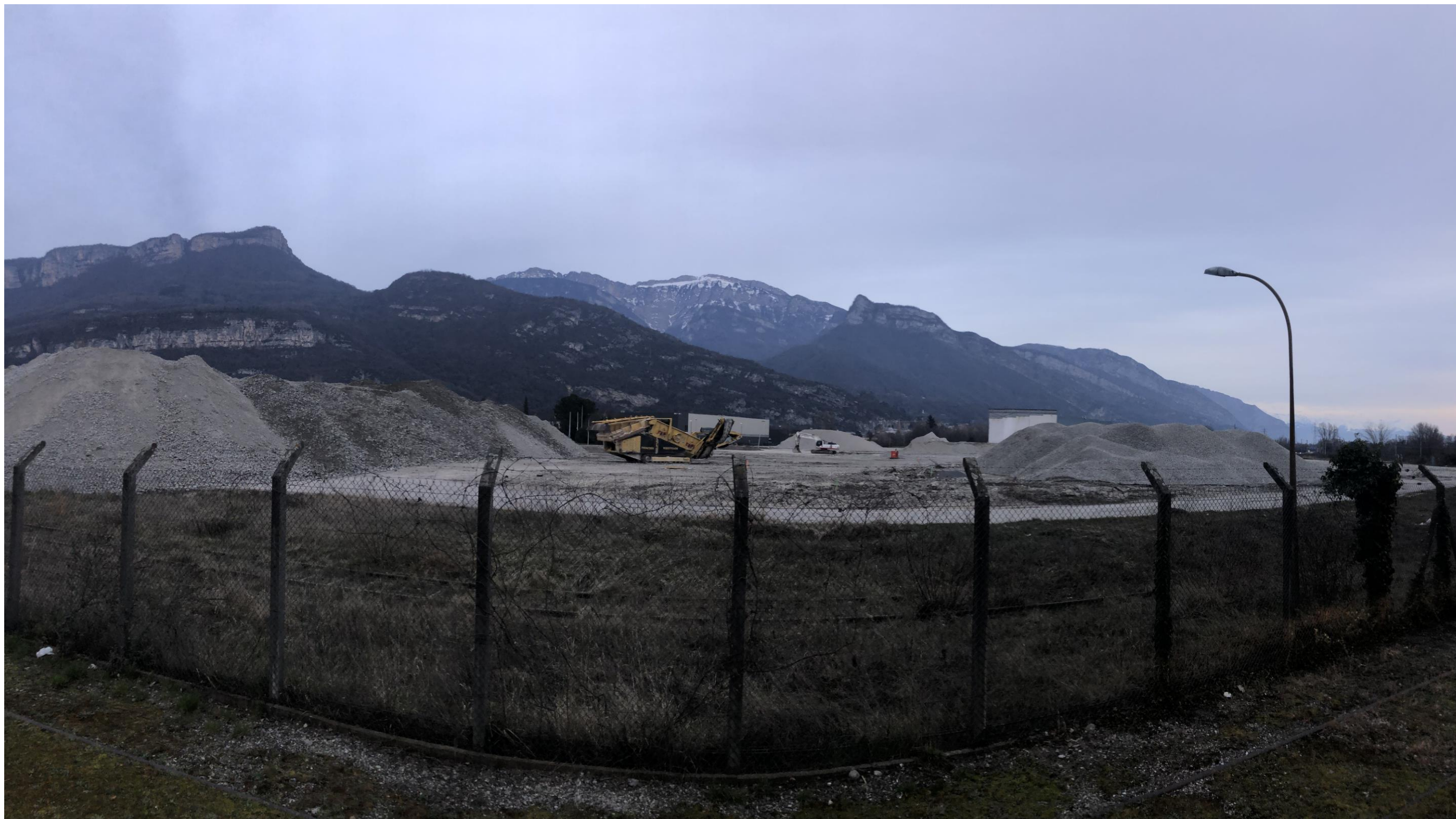
Prise de vue 4 – Février 2021