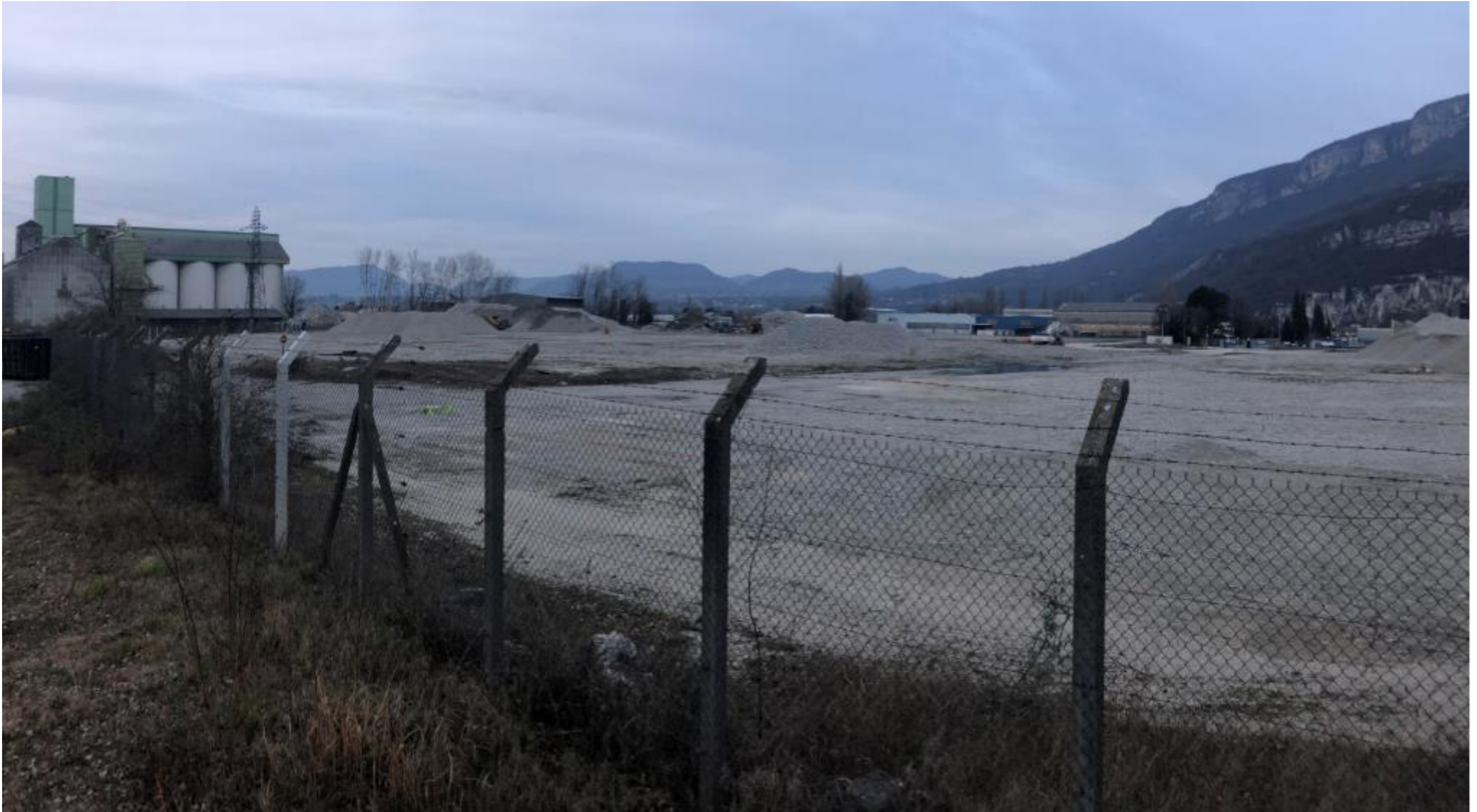
Prise de vue 3 – Février 2021