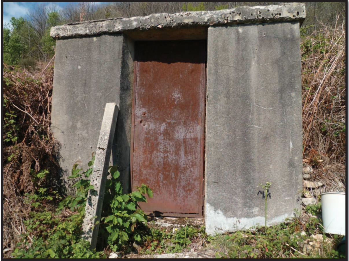
OUVRAGE DE CAPTAGE