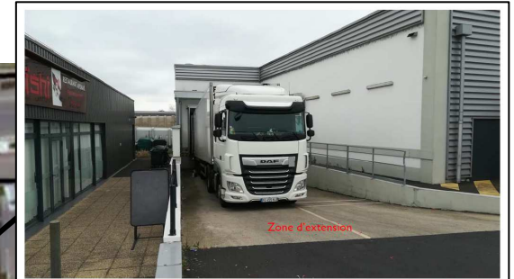
Photographie du site – vue générale zone du quai existant