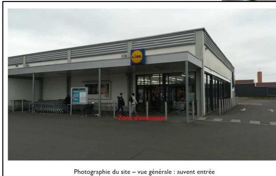
Photographie du site – vue générale : auvent entrée