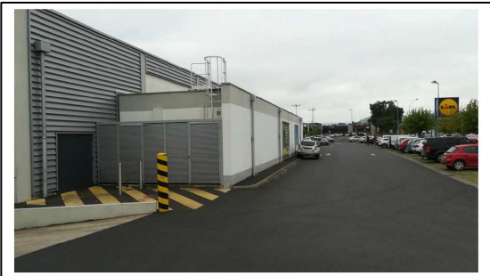
Photographie du site – vue générale zone de la chambre froide et local préparation