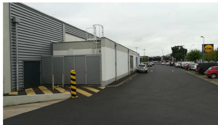
Photographie du site – vue générale zone de la chambre froide et local préparation