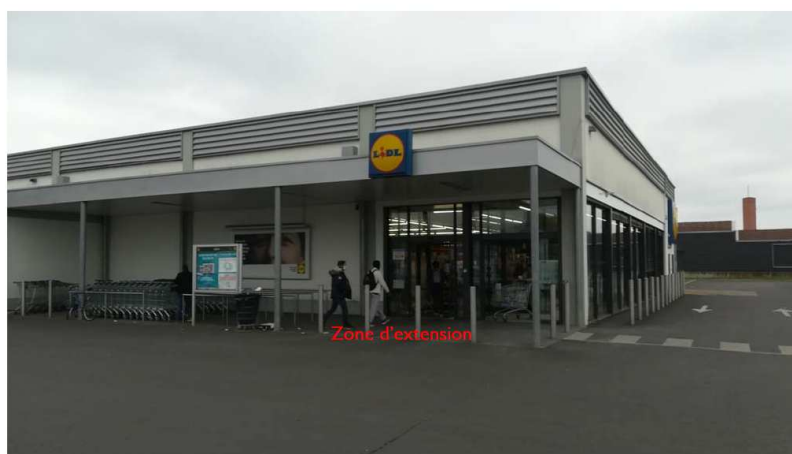
Photographie du site – vue générale : auvent entrée