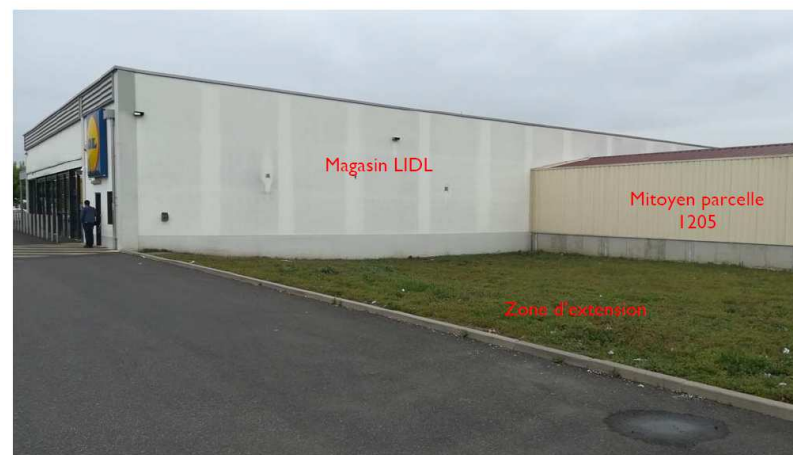
Photographie du site – vue générale : jonction entre le magasin LIDL et le mitoyen de la parcelle 1205