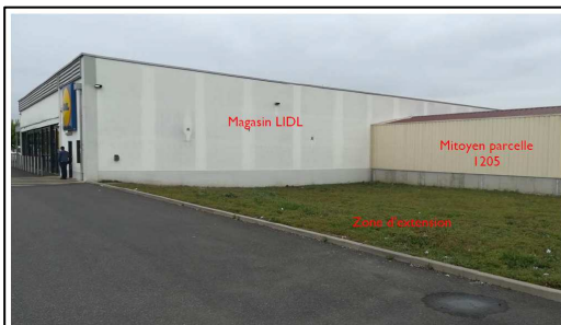
Photographie du site – vue générale : jonction entre le magasin LIDL et le mitoyen de la parcelle 1205