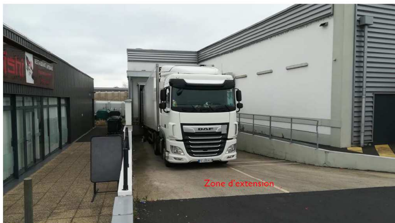
Photographie du site – vue générale zone du quai existant