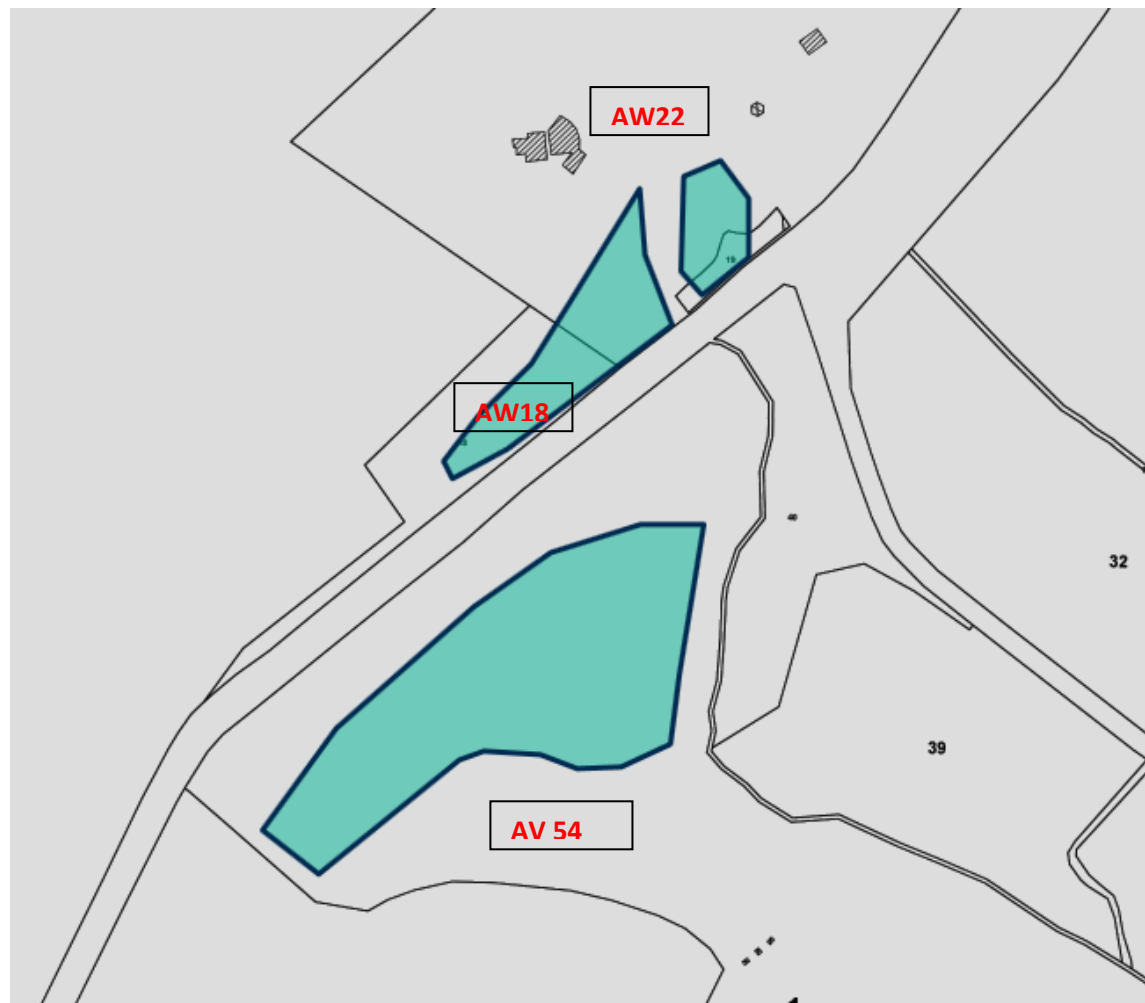
Figure 3 : Les parcelles cadastrales concernées par le projet