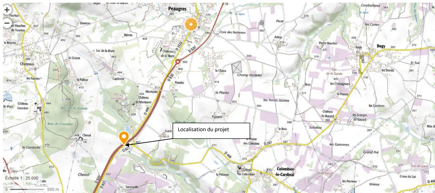
Figure 1 : Carte IGN au 1/25 000 de la localisation du projet (Les parkings du Safari Parc de Peaugres)

Lieu d'implantation des ombrières de parking : Lieu-dit « Montanet » - 07340 Peaugres.