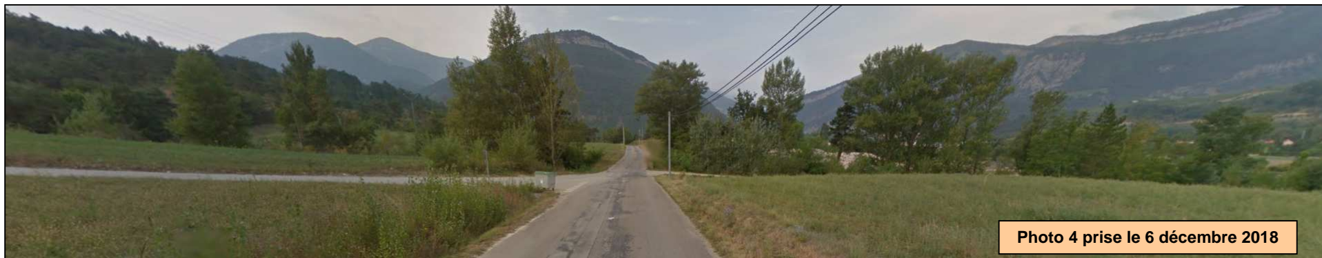
Photo 4 prise le 6 décembre 2018